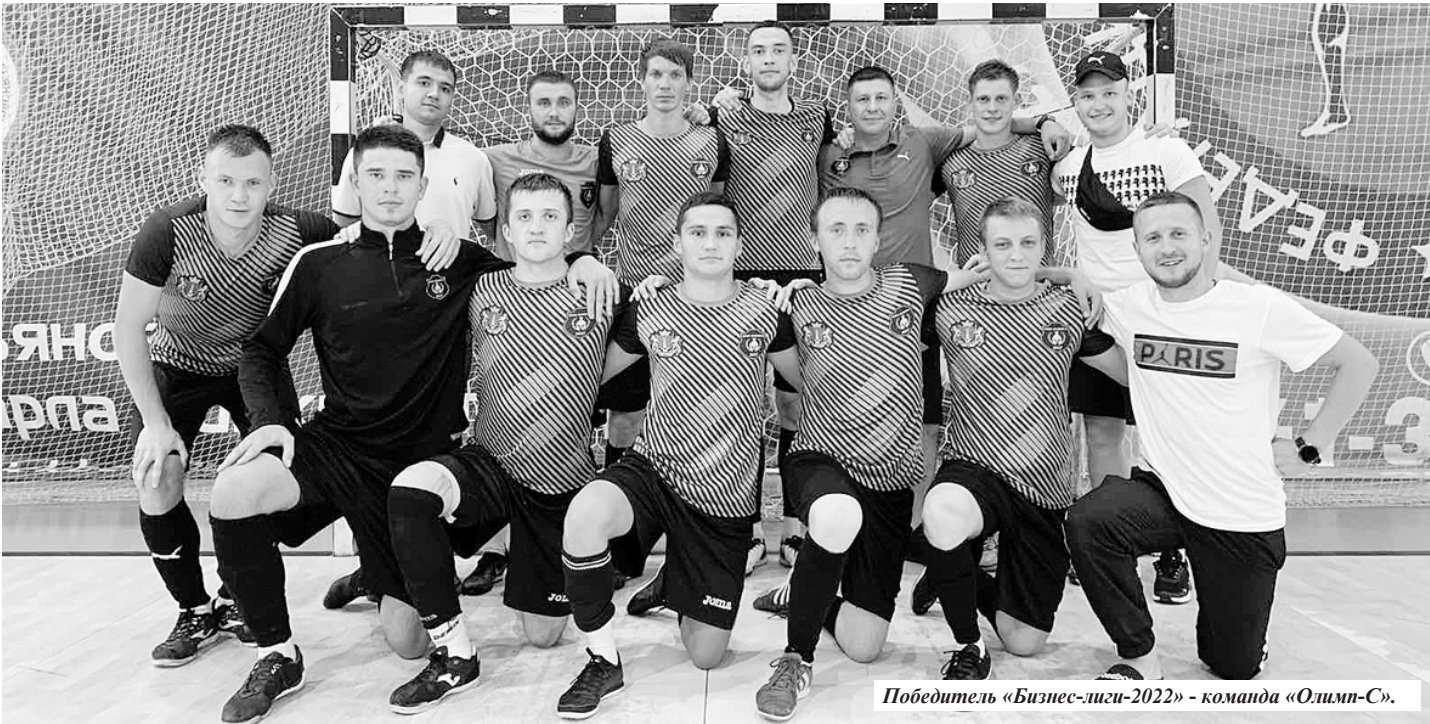
Победитель «Бизнес-лиги-2022» - команда «Олимп-С».