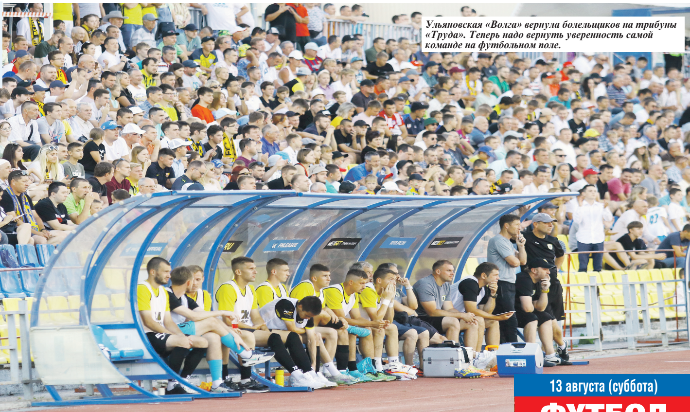
Ульяновская «Волга» вернула болельщиков на трибуны «Труда». Теперь надо вернуть уверенность самой команде на футбольном поле.

13 августа «ВОЛГЕ» предстоит сыграть с челнинским «КАМАЗом». В Ульяновск соперник прибывает в статусе лидера Первой лиги.