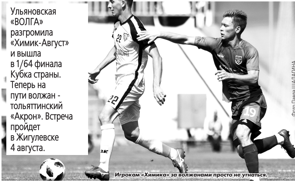
Игрокам «Химика» за волжанами просто не угнаться.

Ульяновская «ВОЛГА» разгромила «Химик-Август» и вышла в 1/64 финала Кубка страны. Теперь на пути волжан - тольяттинский «Акрон». Встреча пройдет в Жигулевске 4 августа.