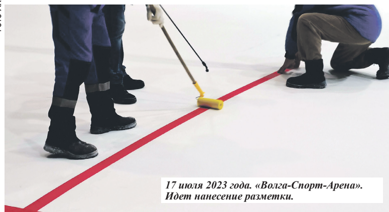
17 июля 2023 года. «Волга-Спорт-Арена». Идет нанесение разметки.

В то же время в Первоуральске команда мастеров сменила название на «СКА-Уральский Трубник».