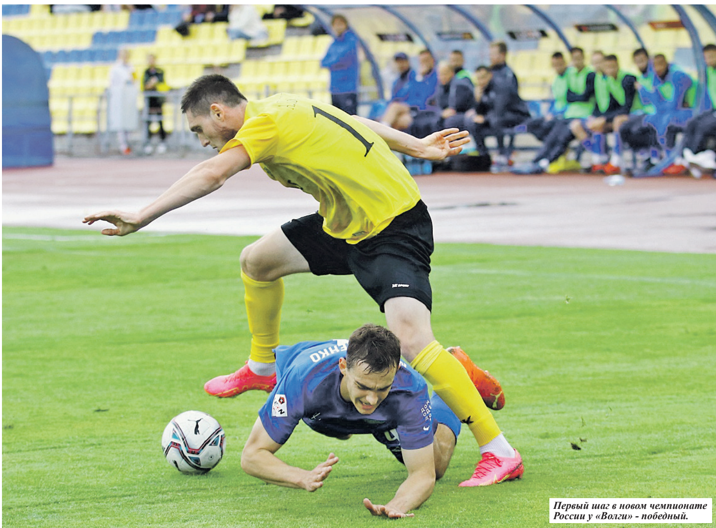
Первый шаг в новом чемпионате России у «Волги» - победный.