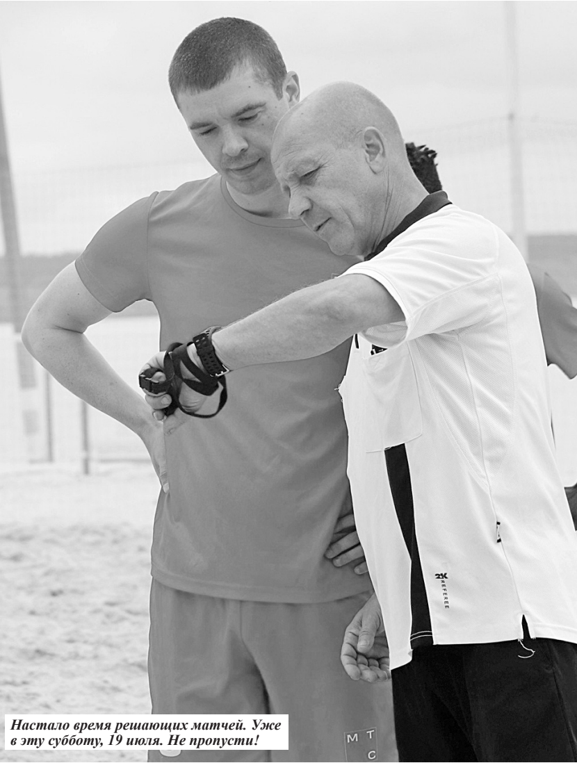
Настало время решающих матчей. Уже в эту субботу, 19 июля. Не пропусти!