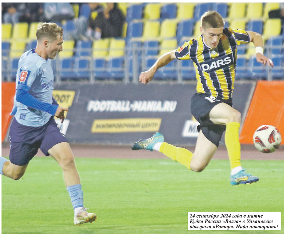
24 сентября 2024 года в матче Кубка России «Волга» в Ульяновске обыграла «Ротор». Надо повторить!

Кто окажется успешнее на этот раз, можно узнать в субботу, 19 июля. Приходи сам и приводи с собой друзей и родственников на центральный стадион «Труд» им. Льва Яшина. Стартовый матч «Волги» в «Лучшей Лиге Мира» - событие, которое нельзя пропустить.