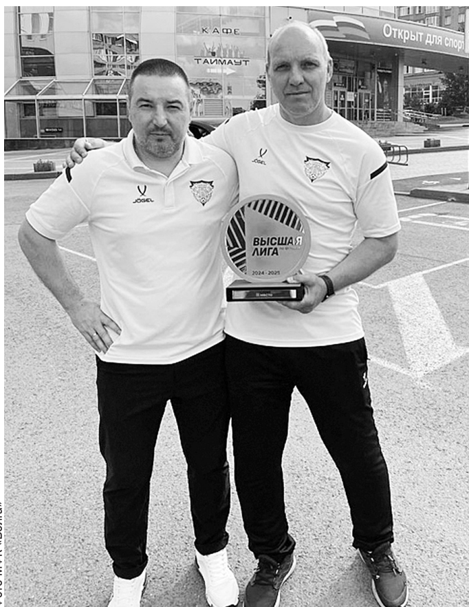
Фото МФК «Волга»

- В первую очередь, нам удалось создать хороший коллектив. В МФК «Волга» не было ни одного случайного человека. В этом заслуга тренерского