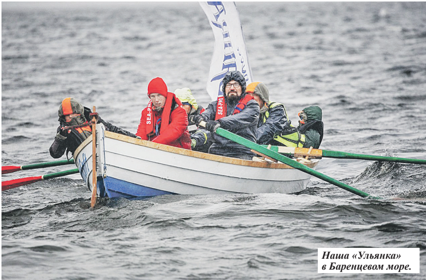
Наша «Ульянка» в Баренцевом море.

На соревнования парусной регаты их пригласил Арктический музей лодки. Для участия в состязании организаторы отправили комплект деталей судна, который команде необходимо было собрать. Два месяца юные корабелы сами создавали карбас: соединяли де-