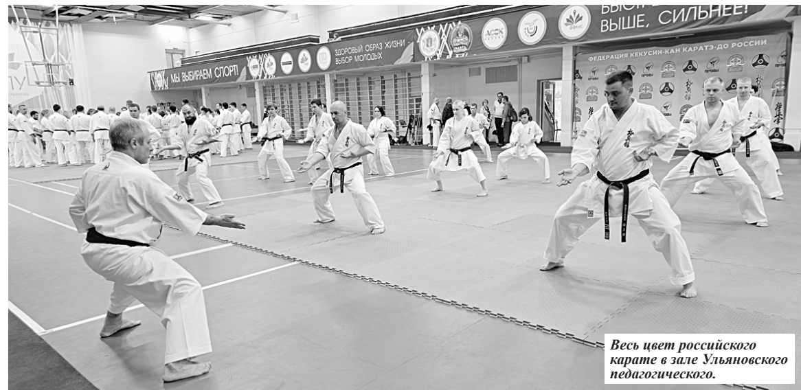
Весь цвет российского карате в зале Ульяновского педагогического.

го на один голос - 6:5. В итоге наш регион так здорово организовал мероприятие, что понравилось и запомнилось это не только участникам «Летней школы», но и руководству Всероссийской федерации кекусин-кан карате-до. В 2025 году проведение «Летней школы» планировалось в Калининграде, но у этого города возникли какие-то сложности с организацией. В итоге, когда на собрании президиума Федерации встал вопрос о выборе другого города для проведения «Летней школы», было принято решение, что второй год подряд сборы пройдут в Ульяновске».