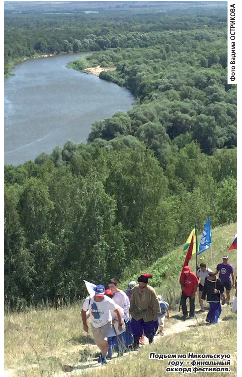
Подъем на Никольскую гору - финальный аккорд фестиваля.