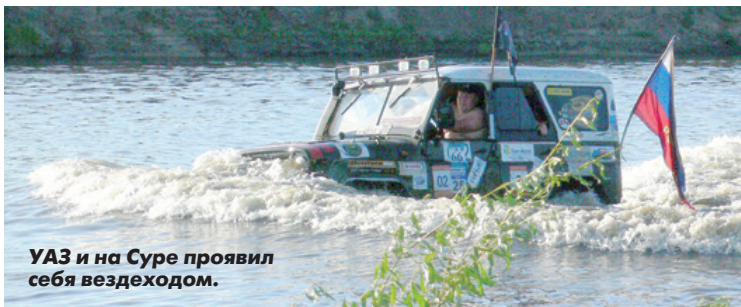
УАЗ и на Суре проявил себя вездеходом.