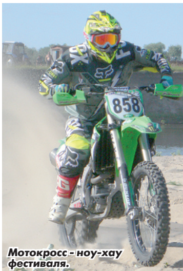
Мотокросс - ноу-хау фестиваля.

Большинство мероприятий фестиваля прошли в селе Кадышево Карсунского района. По традиции, заложенной в прошлом году, его старт ознаменовался выстрелом