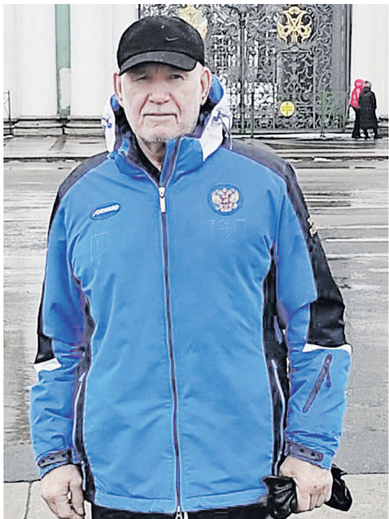
фото из личного архива