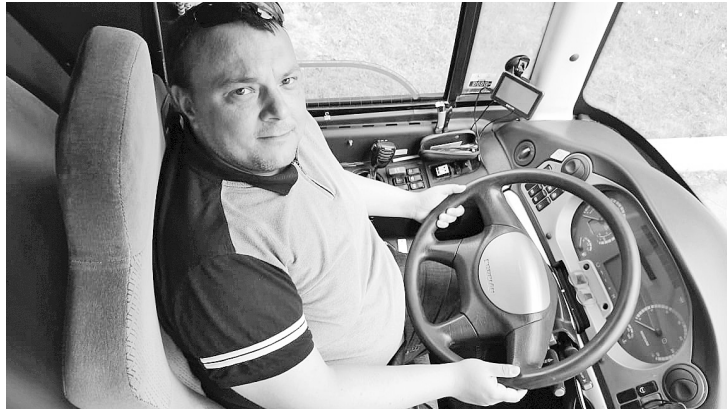
Когда у руля пресс-службы такой атташе, «Волга» точно будет бороться за самые высокие места.