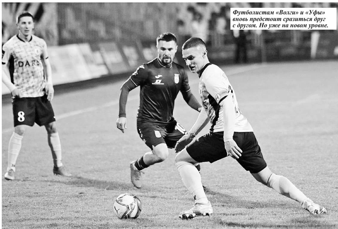
Футболистам «Волги» и «Уфы» вновь предстоит сразиться друг с другом. Но уже на новом уровне.