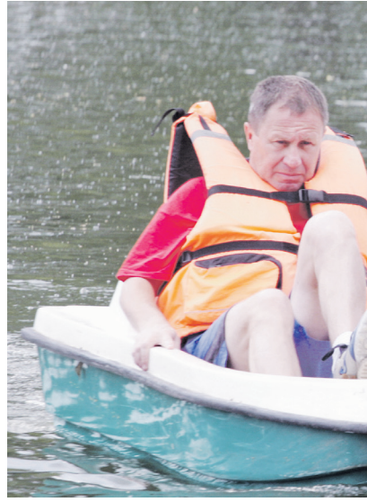
Соревнования на водных велосипедах получились самыми эмоциональными.