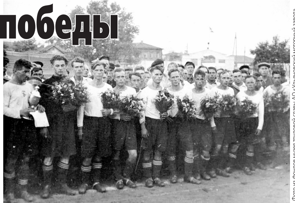
Команда УЗМД - 4-кратный обладатель Кубка области. 15 июля 1952 года, городской стадион «Спартак».