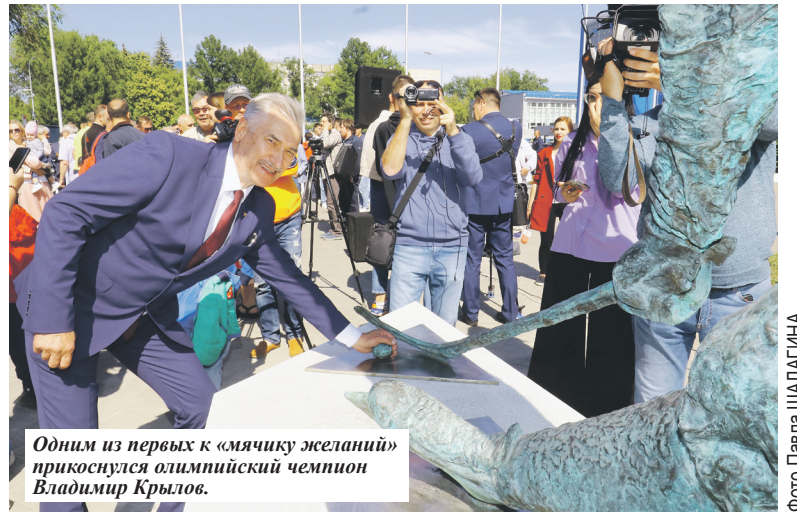
Одним из первых к «мячику желаний» прикоснулся олимпийский чемпион Владимир Крылов.