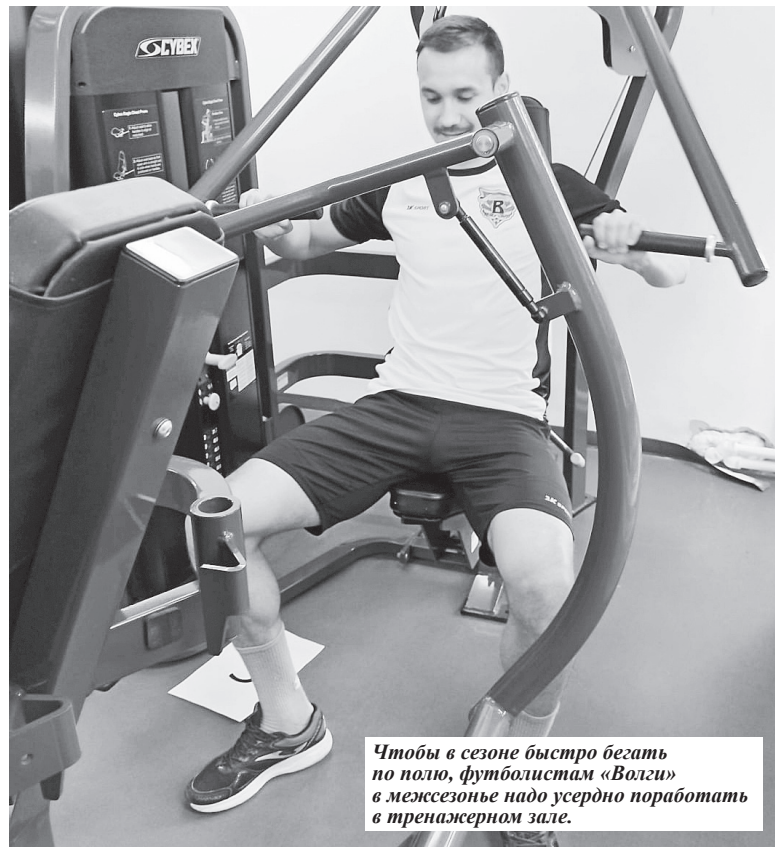
Чтобы в сезоне быстро бегать по полю, футболистам «Волги» в межсезонье надо усердно поработать в тренажерном зале.