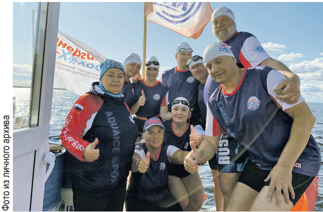
Вот эта команда преодолела более 700 километров в холодной воде Енисея.

- Впрочем, не только с людьми довелось повстречаться на долгом пути, - продолжает ульяновская спортсменка. - Однажды во время одного из моих этапов на берег из леса выскочил бурый мишка. Видимо, ему интересно стало, что же это за корабль идет по Енисею. Какое-то время он сопровождал нашу команду, а потом ушел в лес. Страшно не было, ведь риск встретиться с хищником с глазу на глаз был минимальным. Если бы мишка вошел в воду, у меня была надежная защита - рядом с каждым участником постоянно дежурила лодка сопровождения. А однажды у деревни Потаповка проходили мимо места, где гнездятся тысячи лебедей - такого большого количества этих красивых птиц одновременно я никогда не встречала! В общем, заплыв оставил море впечатлений. Две недели пролетели, как один миг. Трудности все забудутся, останутся только положительные эмоции.