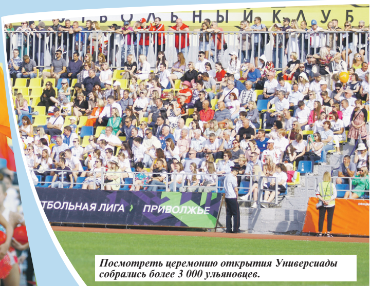
Посмотреть церемонию открытия Универсиады собрались более 3 000 ульяновцев.