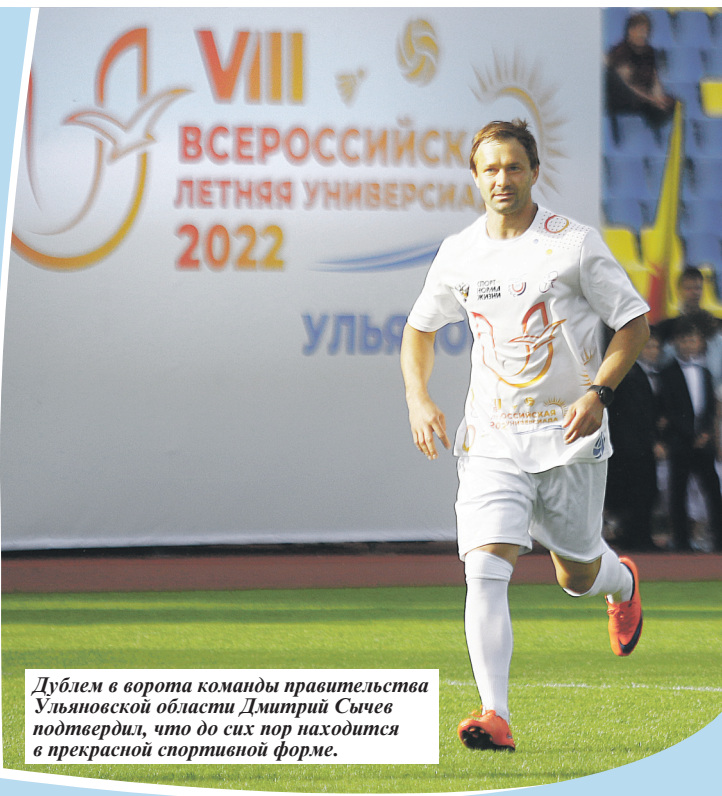
Дублем в ворота команды правительства Ульяновской области Дмитрий Сычев подтвердил, что до сих пор находится в прекрасной спортивной форме.