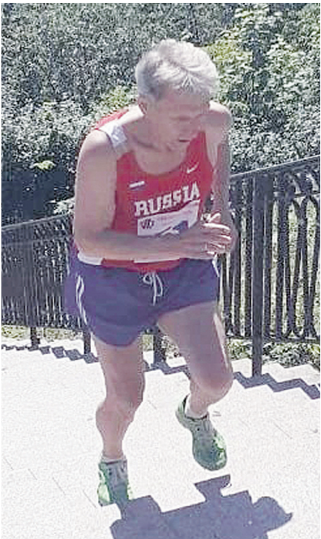
Тот самый «вертикальный» участок лестницы, где, кроме силы и выносливости, нужно проявить морально-волевые качества.

Этому способствовала физкультурно-спортивная акция «Симбирские ступени» - забег на скорость по лестнице у областного краеведческого музея.