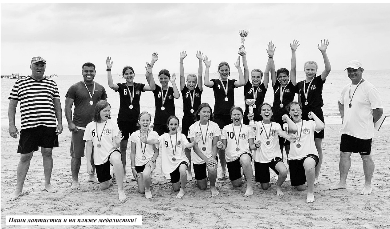
Наши лаптистки и на пляже медалистки!