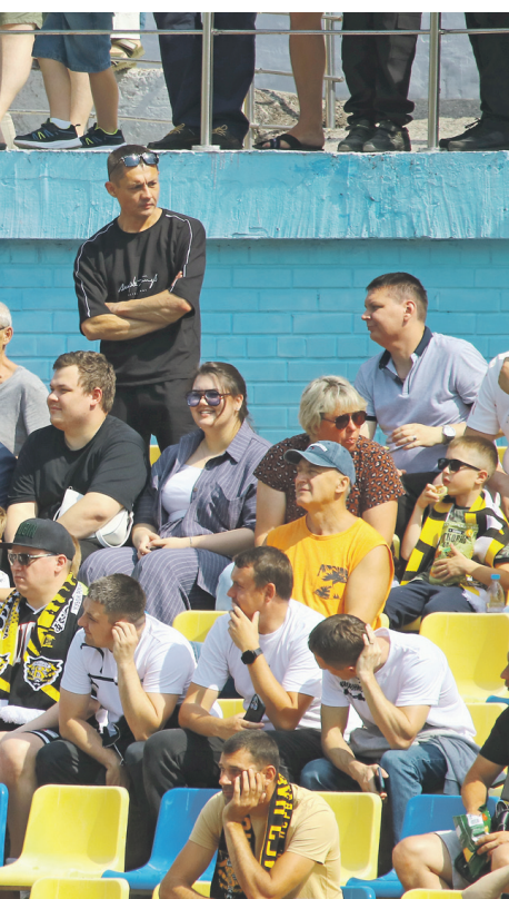
с другими болельщиками ульяновской команды.