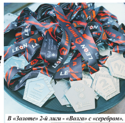
В «Золоте» 2-й лиги - «Волга» с «серебром».