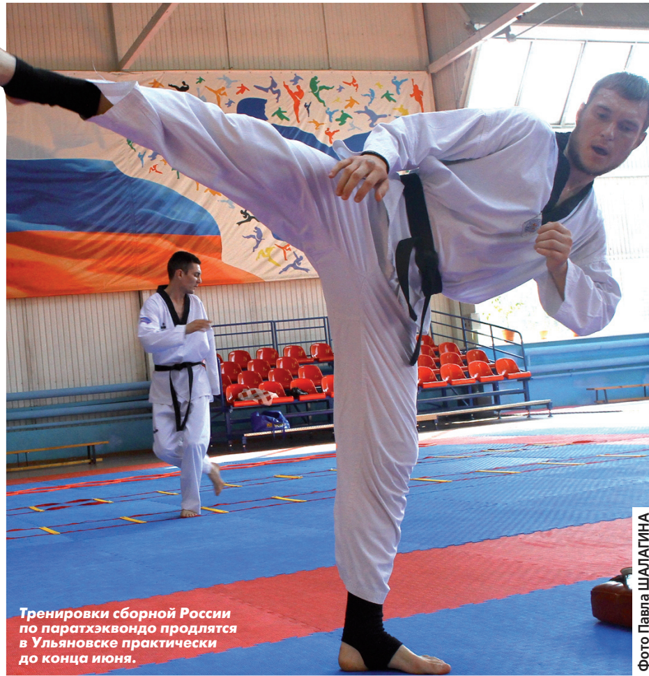
Тренировки сборной России по паратхэквондо продлятся в Ульяновске практически до конца июня.