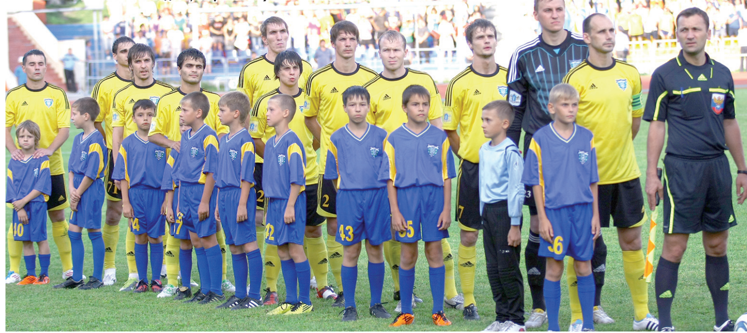
17 июля 2011 года. 1/16 финала Кубка России. «Волга» вышла на бой с «Анжи».