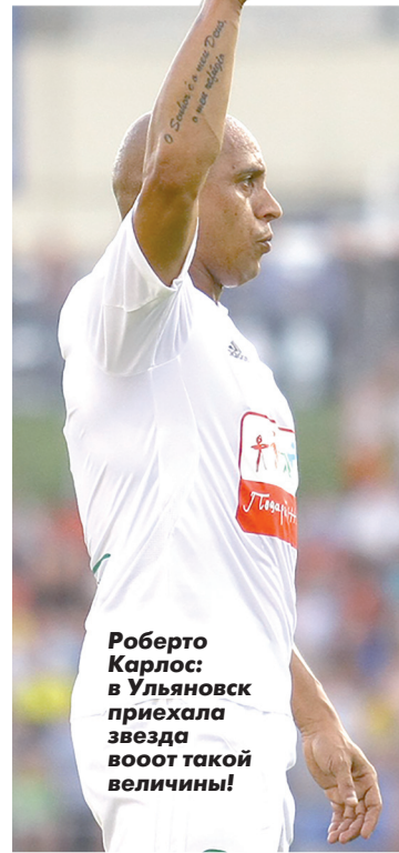
Роберто Карлос в Ульяновске приехала звезда воюет такой величины!