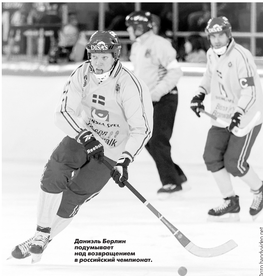
Даниэль Берлин подумывает над возвращением в российский чемпионат.

- Участие в Кубке мира влечет за собой очень серьезные расходы. К тому же