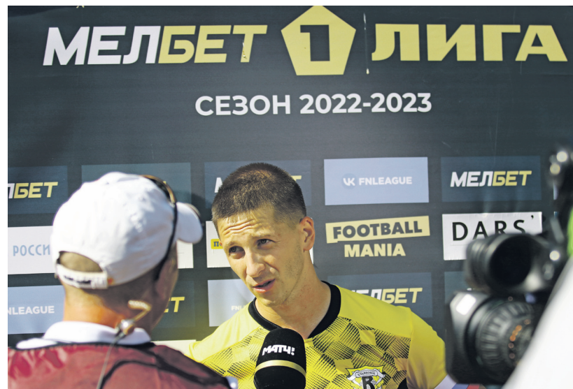
Съемочные группы «Матч-ТВ» на домашних матчах «Волги» в минувшем сезоне - частые гости.