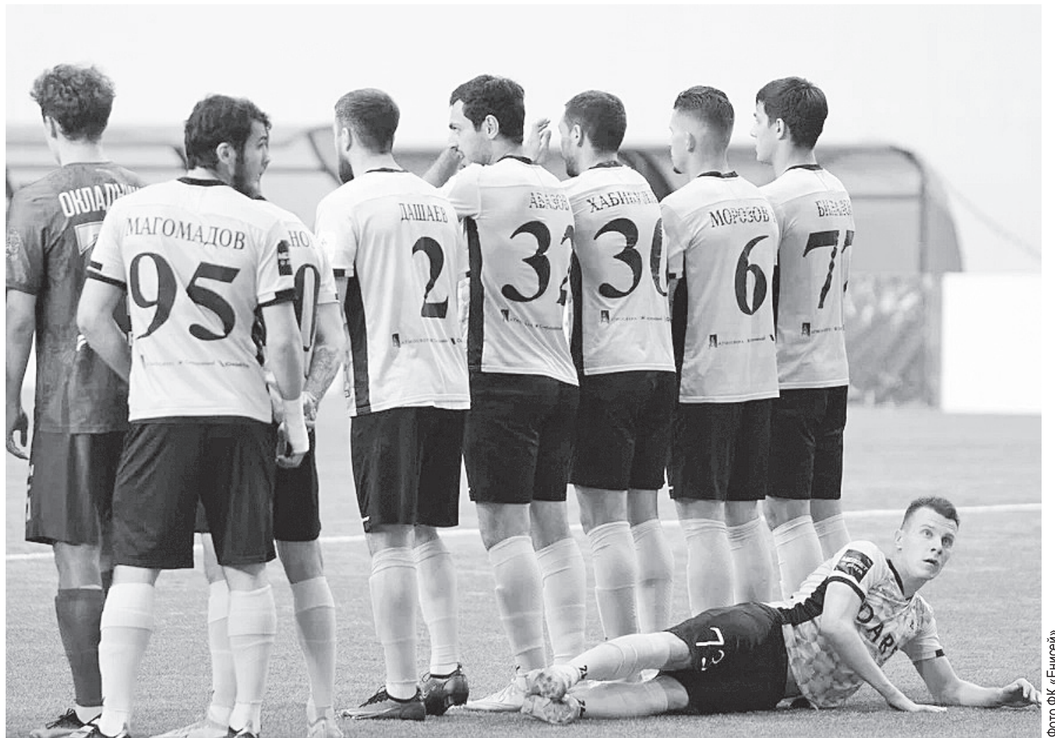
Чем плотнее «стенка», тем надежнее прикрыты ворота «Волги».