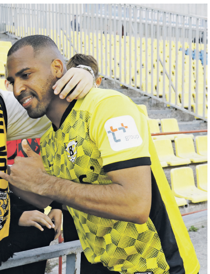
«Волгу» мало, а с болельщиками