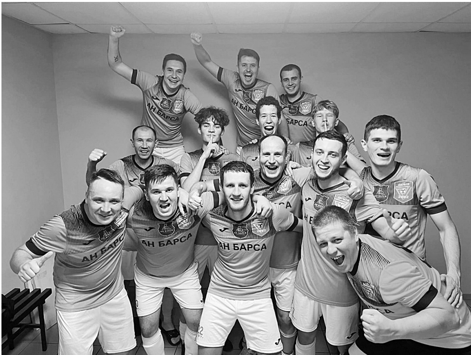
В этом сезоне футзалистов «Дельты АН Барса» пока никто не может обыграть.

Голы: Еремин, 5 (0:1); Дронин, 8 (1:1); Рукин, 12, Ильмухин, 12 (1:3); Баландин, 14 (2:3); Еремин, 17; Скоромный, 17 (2:5); Таиров, 18, 21; Денисов, 25 (5:5); Рукин, 26, 28 (5:7).