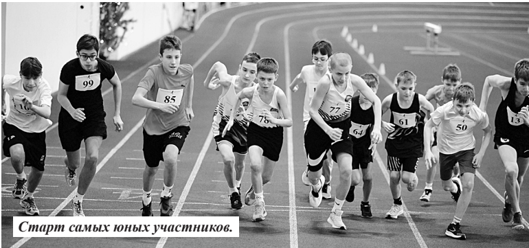
Старт самых юных участников.