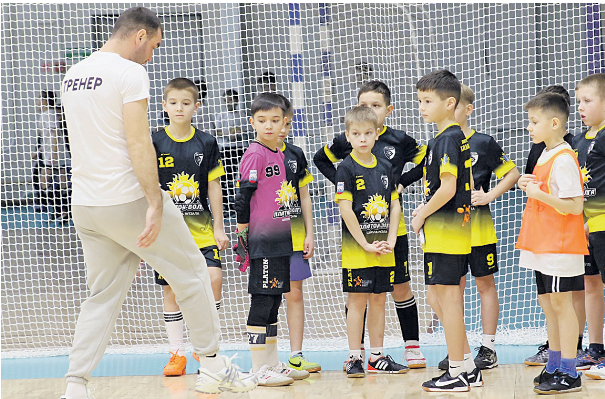
Теперь ульяновские мальчишки могут обучаться футзалу в специализированной детской школе.

Результат: футзальная школа в регионе была образована полтора года назад. В ней занимаются 240 детей разных возрастов, что свидетельствует об интересе к этому виду спорта. На данный момент школа работает за счет частного спонсорского финанси-