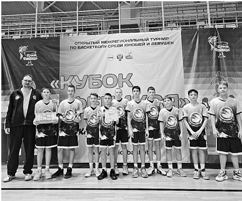
Команда «Симбирские Орлы» - полуфиналист престижного турнира «Кубок Феникса».