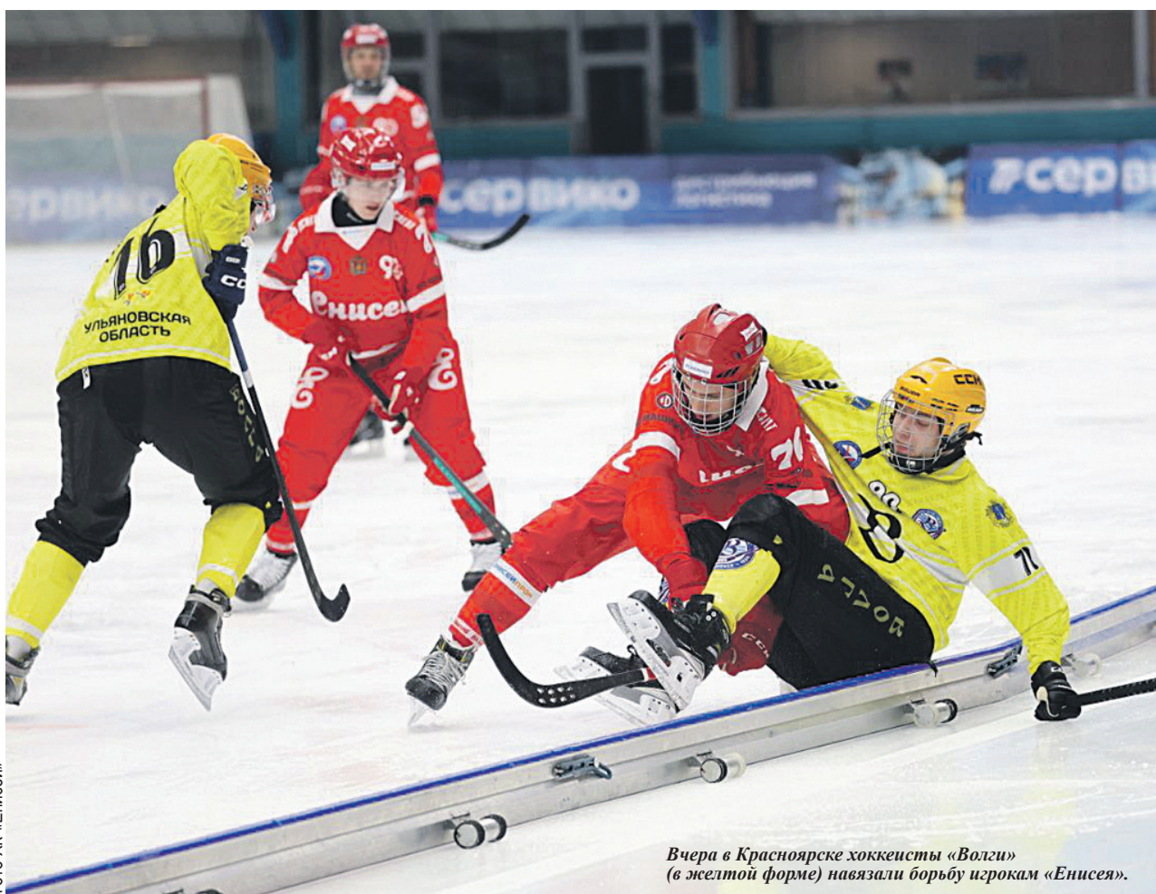
Вчера в Красноярске хоккеисты «Волги» (в желтой форме) навязали борьбу игрокам «Енисея».

Вчера ульяновская «ВОЛГА» уступила в Красноярске местному «Енисею». Однако за такое поражение вряд ли можно сильно упрекнуть нашу команду.