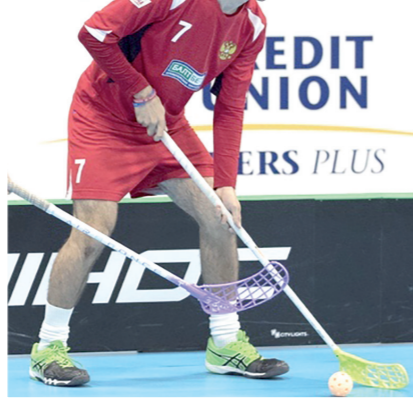
В первом матче было немного неприятно, так как пришлось играть уже через семь часов после прилета.