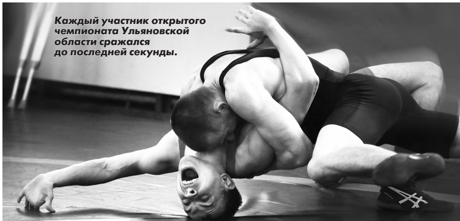
Каждый участник открытого чемпионата Ульяновской области сражался до последней секунды.