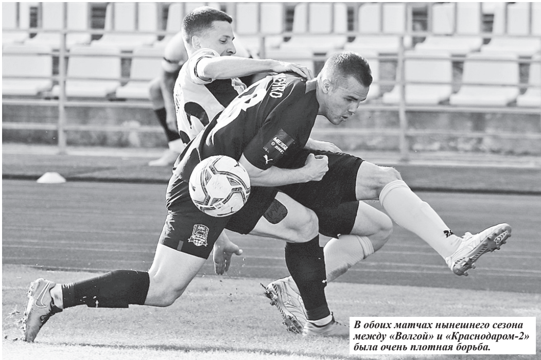
В обоих матчах нынешнего сезона между «Волгой» и «Краснодаром-2» была очень плотная борьба.