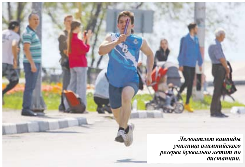
Легкоатлет команды училища олимпийского резерва буквально летит по дистанции.

В зачете слабовидящих спортсменов отличилась единственная иногородняя команда 81-й эстафеты - беговая дружина федерации спорта слепых города Чебоксары.