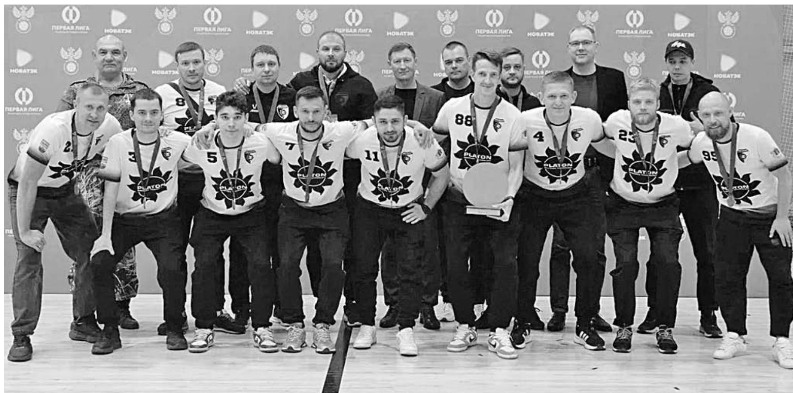
«Платон» завершил домашний турнир Первой лиги на третьем месте.

Добавим, что новым чемпионом Первой лиги стал тюменский «Вектор», переигравший в финале команду из ХМАО со счетом 4:1.