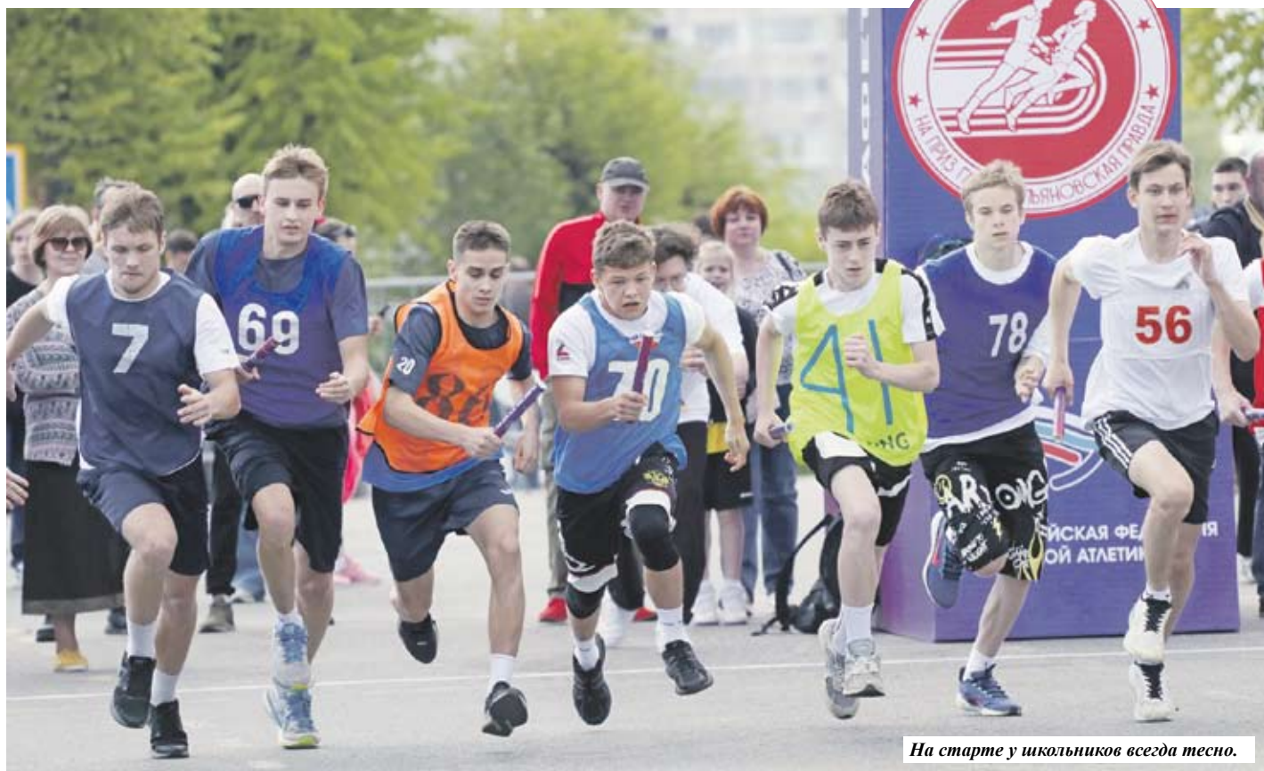
На старте у школьников всегда тесно.

81-я областная легкоатлетическая эстафета на приз газеты «Ульяновская правда» стала самым массовым спортивным событием весны в 73-м регионе. В забегах по исторической части города приняли участие 3 045 спортсменов из 155 команд.