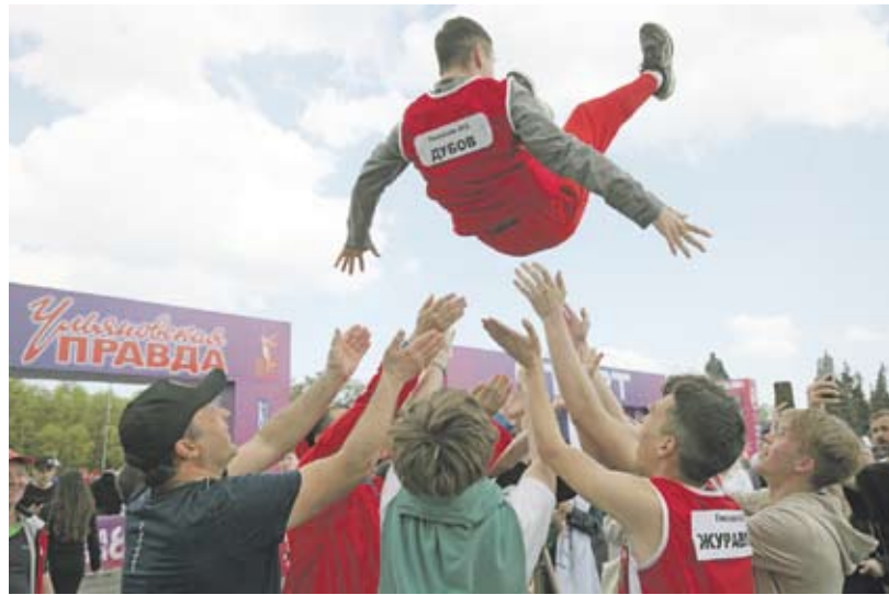
Первая гимназия умеет праздновать победы на областной эстафете.

Главный «отрыв дня» на этой эстафете обеспечили девушки училища олимпийского резерва. Второму месту в зачете четвертой группы (ссу-