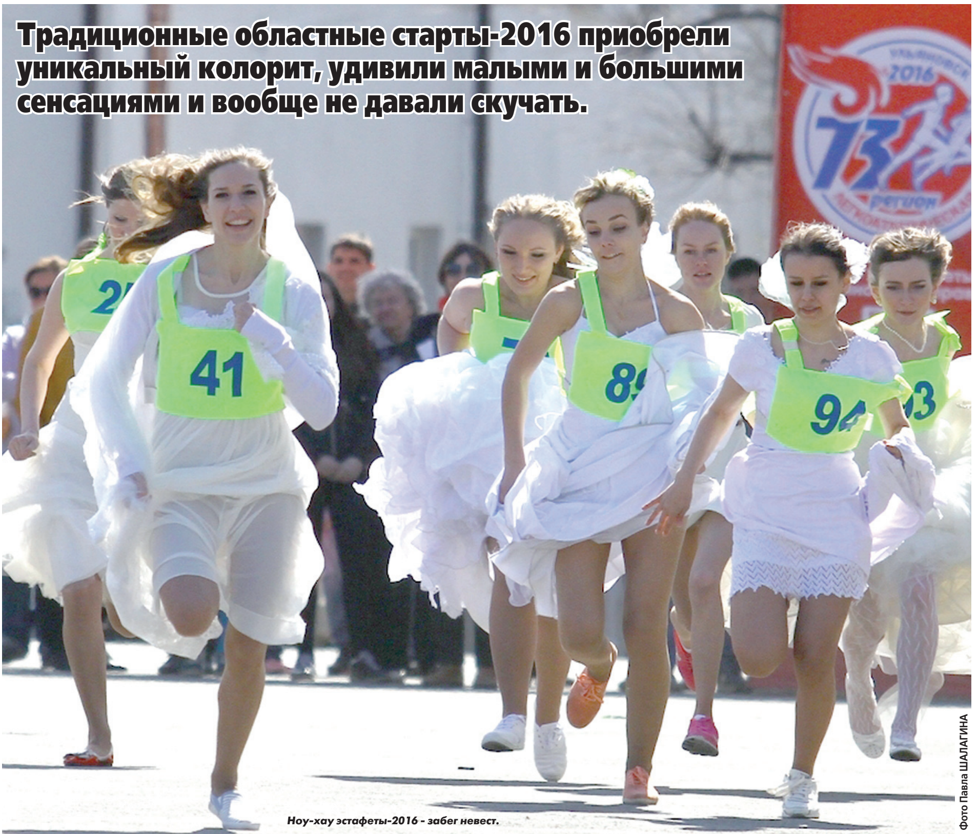
Ноу-хау эстафеты-2016 - забег невест.

Традиционные областные старты-2016 приобрели уникальный колорит, удивили малыми и большими сенсациями и вообще не давали скучать.