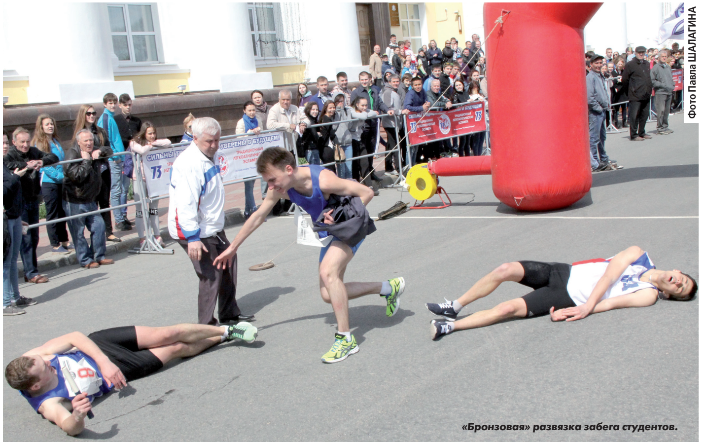
«Бронзовая» развязка забега студентов.

У выпускников УлГПУ есть красивая традиция: перед тем, как покинуть стены университета, они выигрывают областную эстафету. В 2014-м и 2015-м эта традиция соблюдалась. Не стал исключением и год 2016-й. О том, что ни самарский технический, ни местные вузы «педагогам» не конкуренты, стало ясно, когда забег вернулся