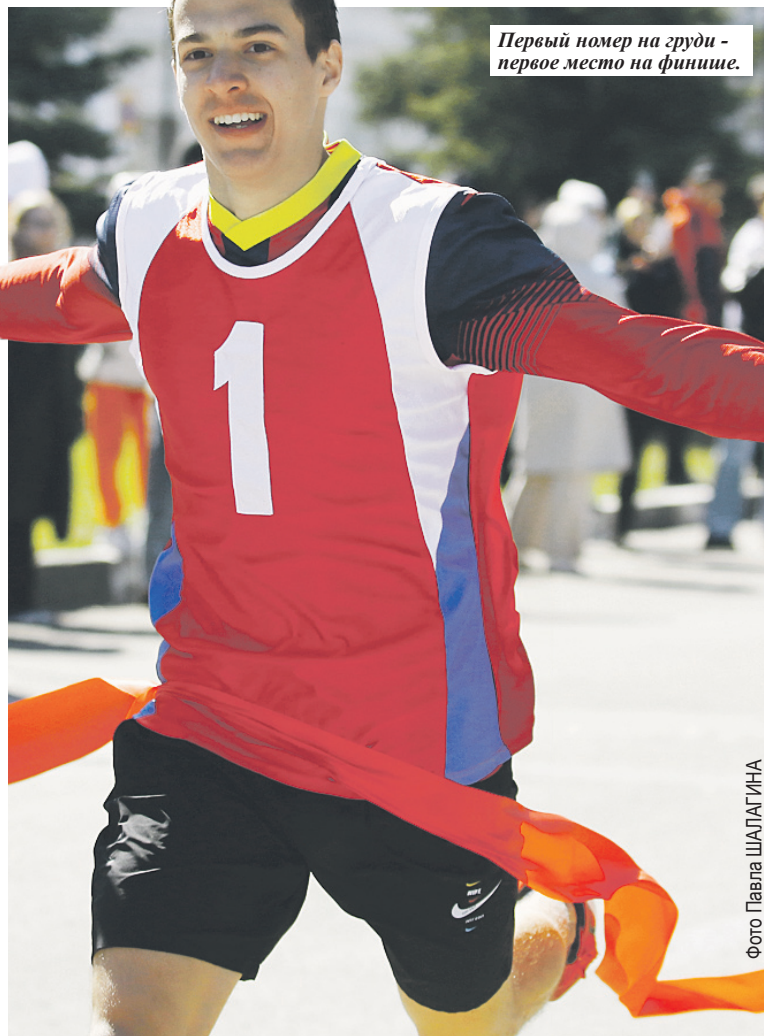
Первый номер на груди - первое место на финише.