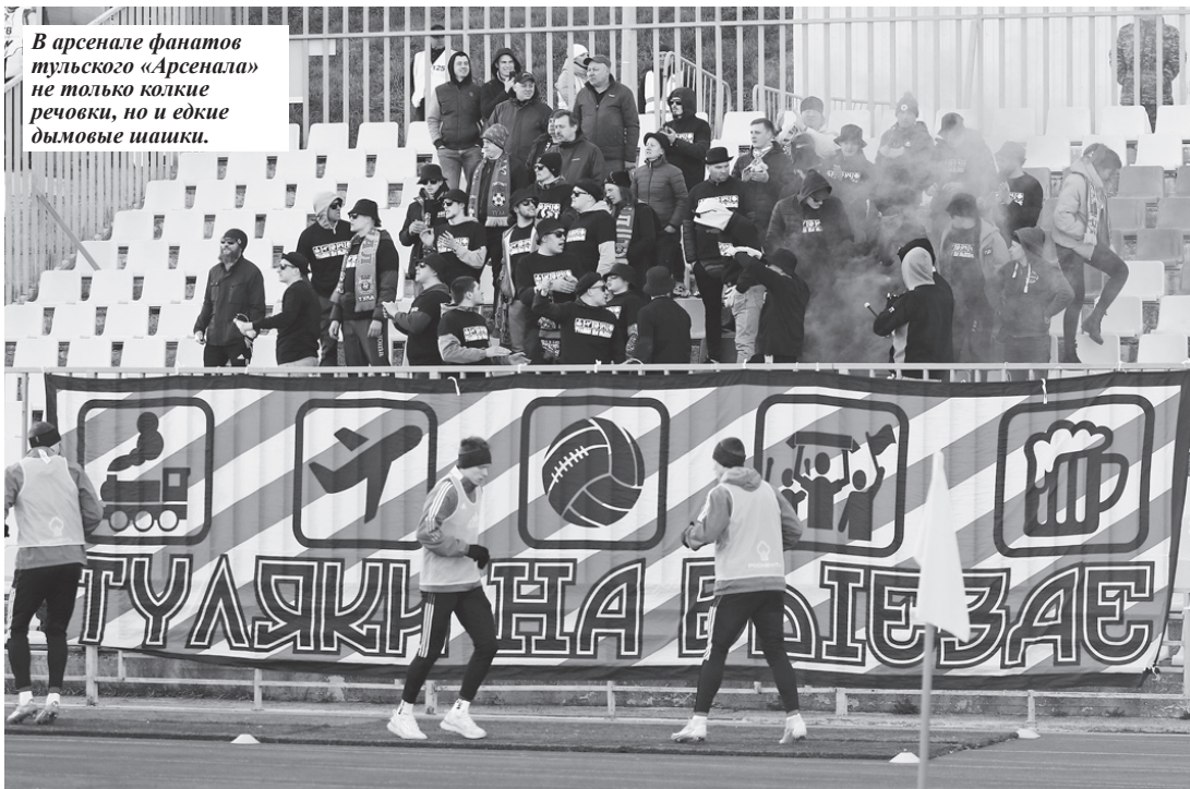
В арсенале фанатов тульского «Арсенала» не только колкие речушки, но и едкие дымовые шашки.