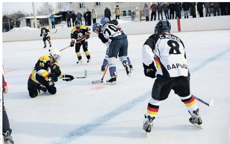
Ледовые сражения хоккеистов - популярное зрелище в Барыше.