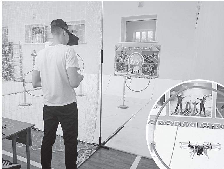
Пилот управляет квадрокоптером в режиме FPV.

участники пролетают по специальной кольцевой трассе, обозначенной флажками и кольцами. А принципиальное различие между ними заключается в способе управления. Квадрокоптерами FPV управляют в VR-очках, когда пилот видит картинку от первого лица, то есть «глазами дрона». В свою очередь, представители номинации «Гонщик БАС» летают в режиме LOS - то есть смотрят на квадрокоптер со стороны. И там, и там соревнуются по времени прохождения трассы.