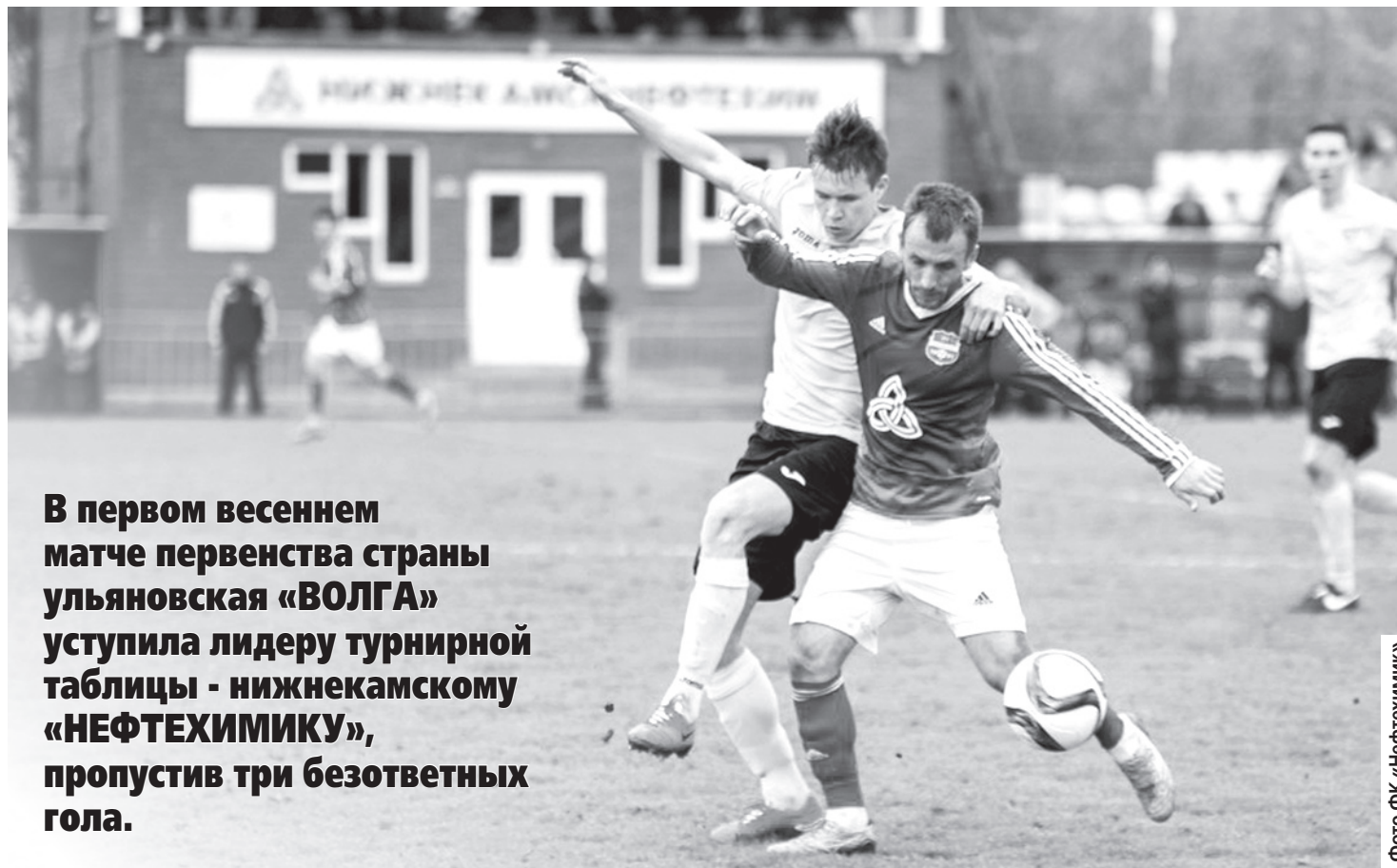
Фото ФК «Нефтехимик»

В первом весеннем матче первенства страны ульяновская «ВОЛГА» уступила лидеру турнирной таблицы - нижекамскому «НЕФТЕХИМИКУ», пропустив три безответных гола.