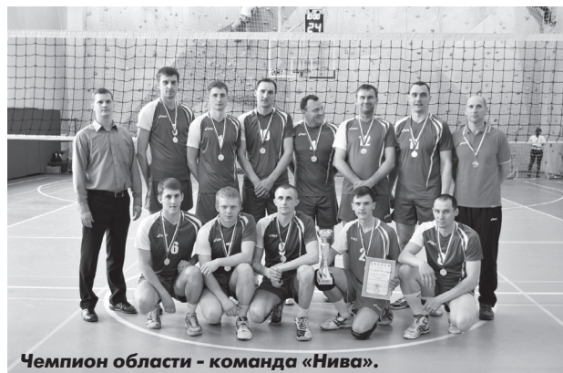
Чемпион области - команда «Нива».