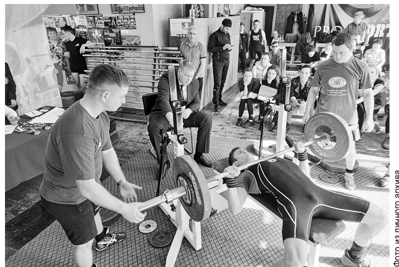
Жим лежа - это борьба не только с соперниками, но и со штангой.

Командный зачет: 1. УлГПУ - 61 очко*, 2. УИ ГА - 55, 3. УлГТУ - 54,