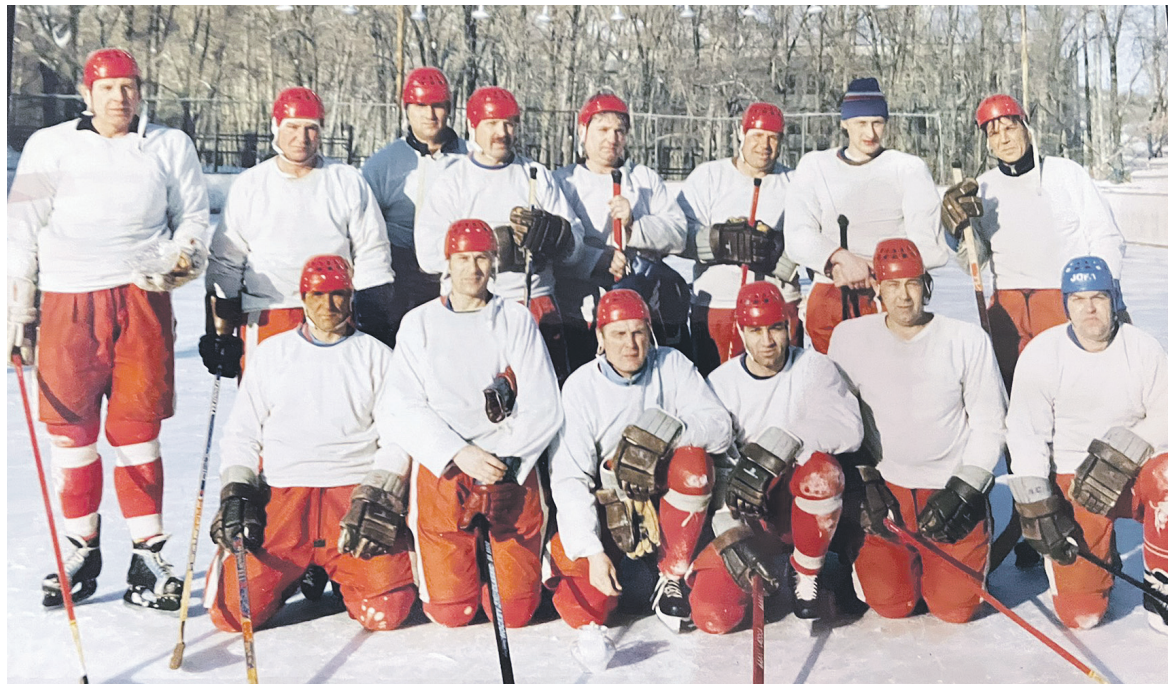
ХК «Цементник». 1994-й год.