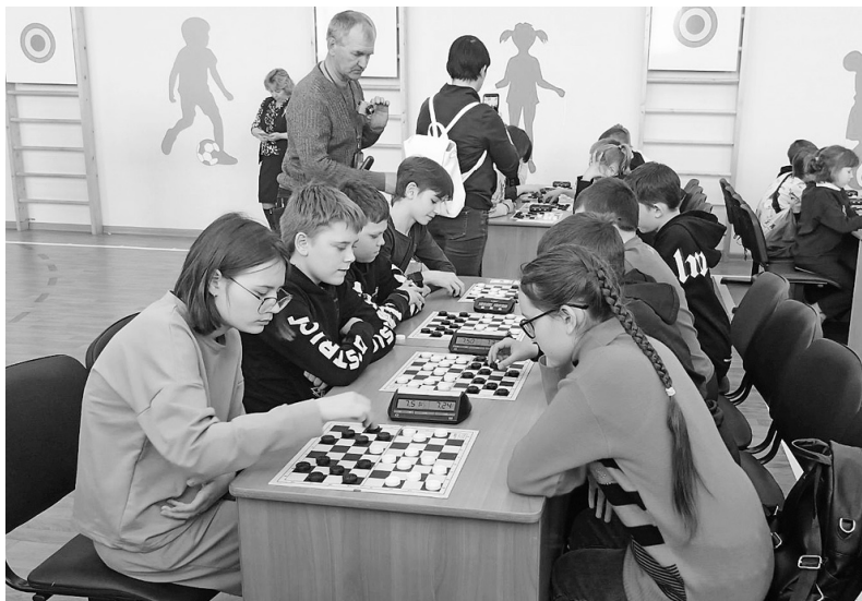
В шашках тоже бьются «стенка на стенку».

Статус главных фаворитов подтвердили юные жители «шашечной