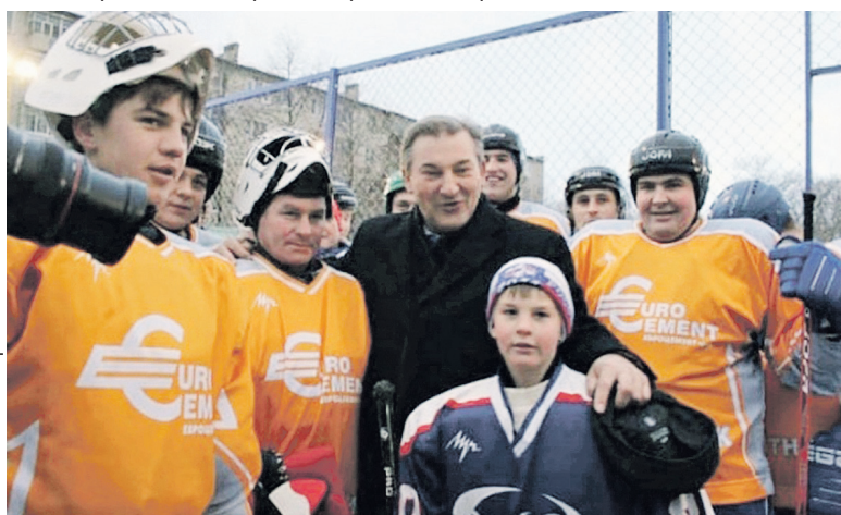
Владислав Третьяк на открытии обновленной хоккейной площадки в Новоульяновске.

Материалы полосы подготовил Александр АГАПОВ