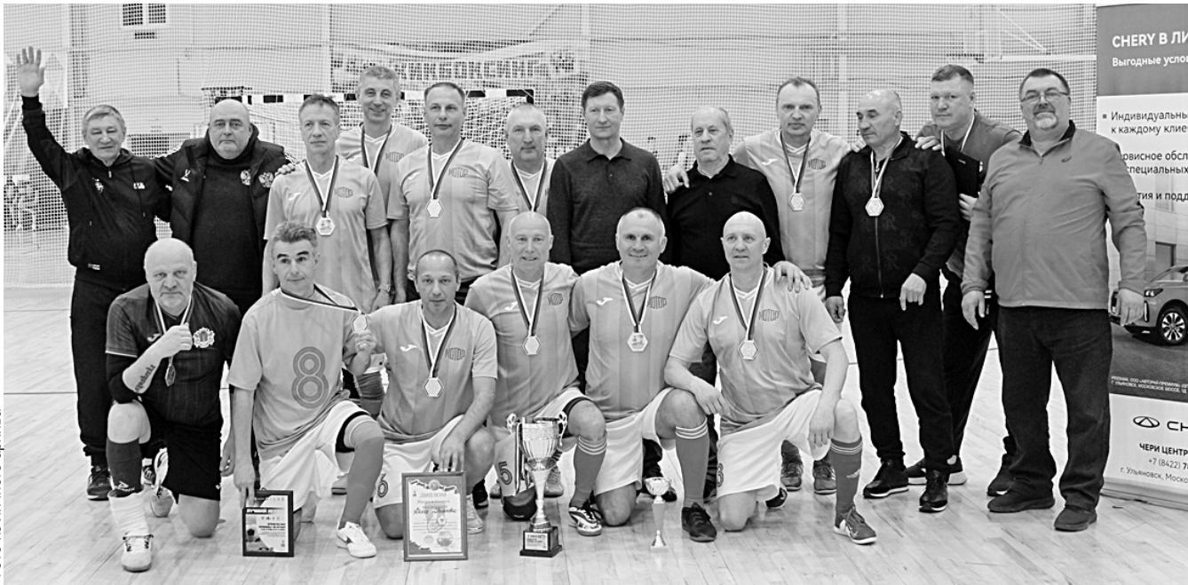
Команда «Волга» - победитель первенства ПФО среди ветеранов «55+».

В УСК «Новое поколение» прошло первенство МФС «Приволжье» среди ветеранов «55+».