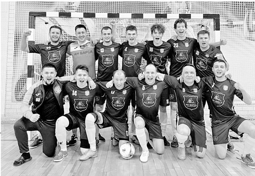
Радости нет предела. Игроки команды «Дельта-АН Барса» - обладатели второй путевки в Суперлигу.

Нынешний розыгрыш Высшей лиги по праву можно назвать бенефисом команды «ПСК». «Строители» набрали 91% очков (49 из 54 возможных) и наколотили больше 100 голов. Лидер атак «ПСК» Камиль Закиров установил впечатляющее достижение, став одновременно лучшим бомбардиром и ассистентом чемпионата. В 17 матчах он забил 29 мячей и отдал 21 результативную передачу!