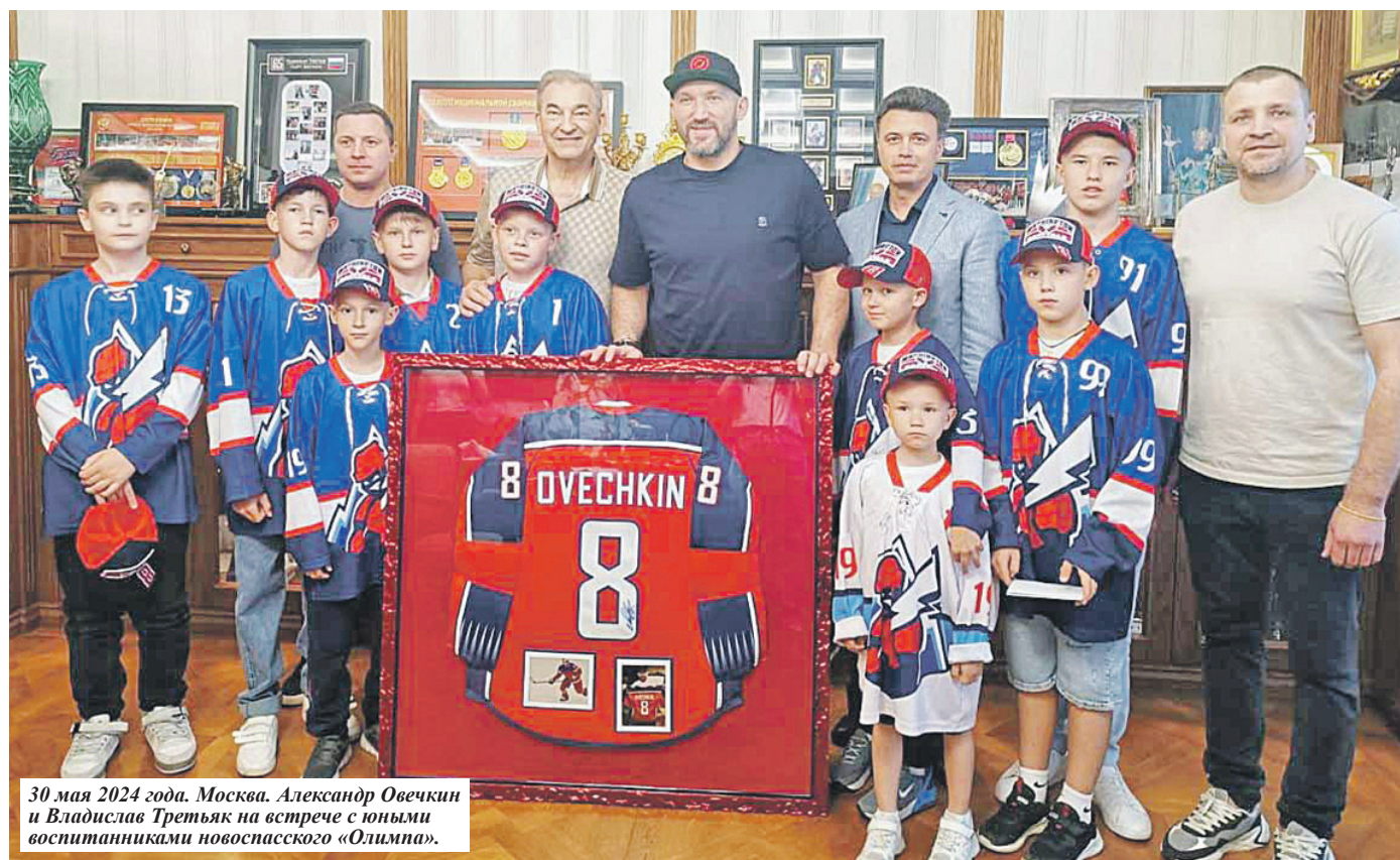
30 мая 2024 года. Москва. Александр Овечкин и Владислав Третьяк на встрече с юными воспитанниками новоспаского «Олимпа».