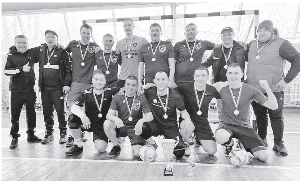
Футболисты команды «Север» своей победой в чемпионате удивили Димитровград.

Все коллективы сыграют друг с другом в один круг. Первый тур запланирован на 30 апреля в Ульяновске, второй - на 3 мая в Инзе либо Николаевке, третий - на 7 мая в Димитровграде и заключительный четвертый - на 9 мая снова в Ульяновске.