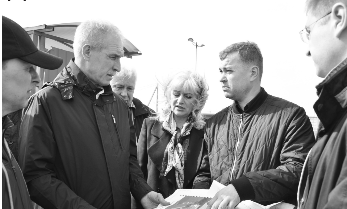
В реальности ульяновский Центр художественной гимнастики будет краше, чем на бумаге.

В августе в Ульяновске начнется строительство Центра художественной гимнастики. Его возведут в рамках реализации федеральной целевой программы.