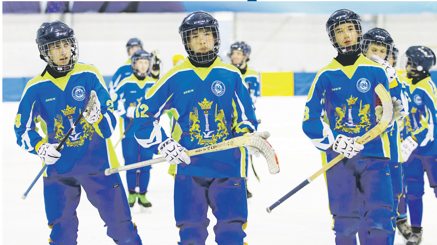
Вчера хоккеисты «СШОР-Волги» на победной ноте завершили первенство России.

Мы даже едим строго в отведенное время, а уж про сон и вовсе нечего говорить. Завоеванная «бронза» для нас хороший результат, хотя могли выступить и лучше. Не смогли должным образом собраться в определенный момент.