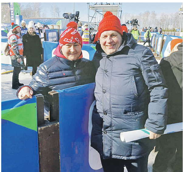
9 марта 2025 года. Казань. Чемпионат России по лыжным гонкам. Известный футбольный судья из Барыша Юрий Рыбаков и трехкратная олимпийская чемпионка Елена Вяльбе.