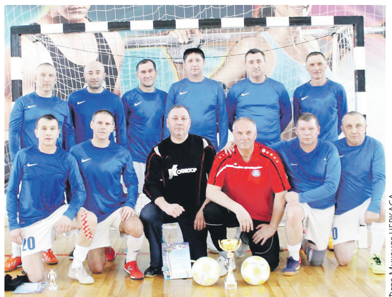
Команда «Симбирск» - обладатель Кубка Ульяновска среди ветеранов 50+.

«Симбирск» взял кубок Ульяновска, но в предстоящую субботу болельщиков ждет вторая часть противостояния. «Ульяновск» и «Симбирск» сыграют «Золотой матч» чемпионата города. Начало игры в «Фаворите» в 16.45.