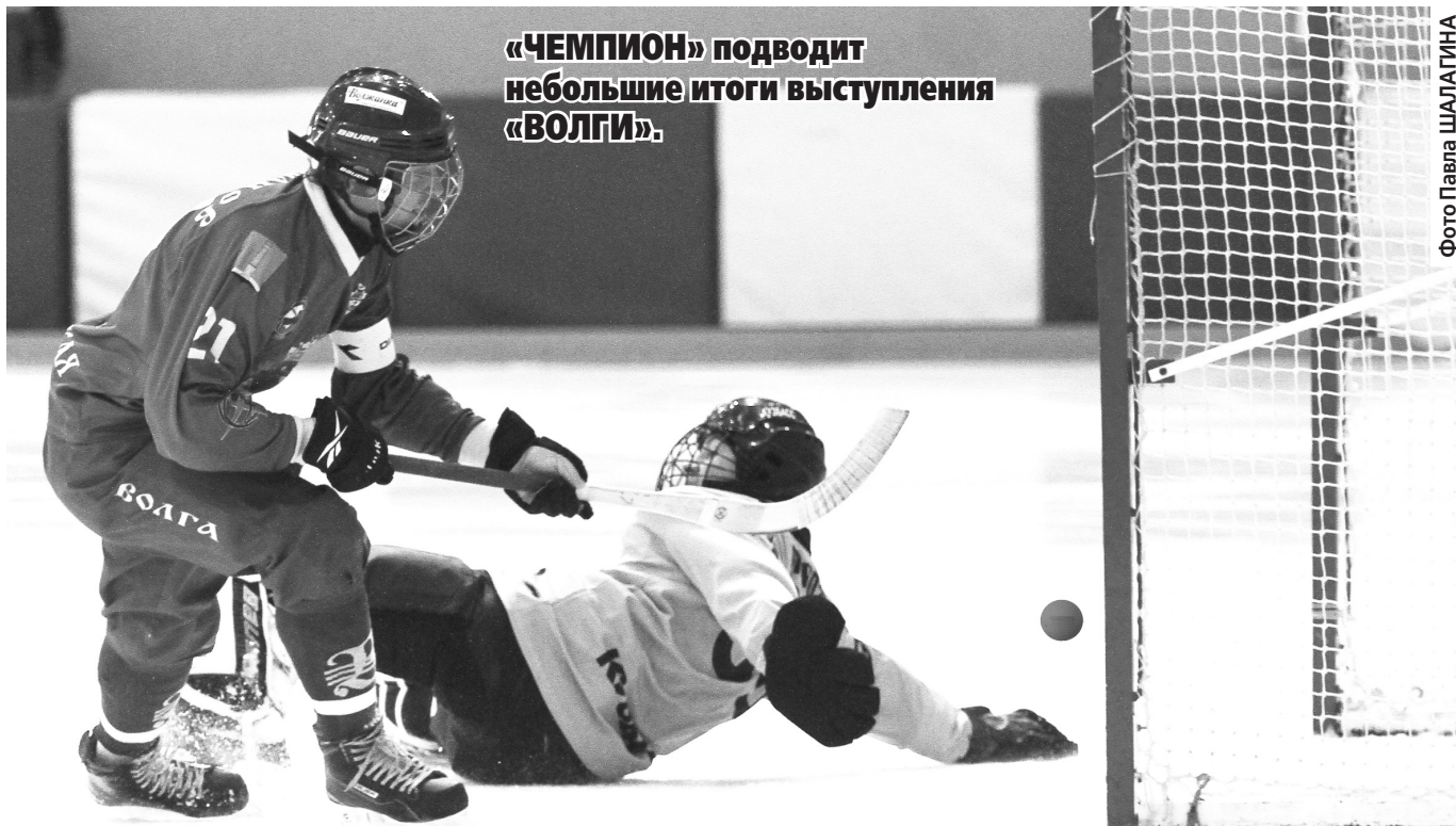
«ЧЕМПИОН» подводит небольшие итоги выступления «ВОЛГИ».