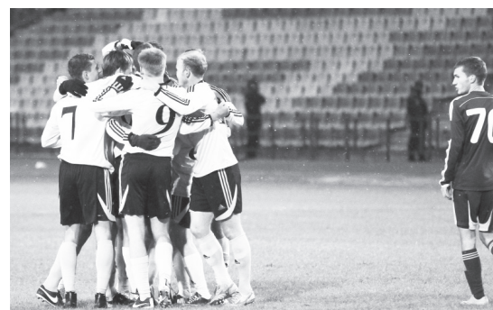
О матче «Волга» - «Нефтехимик» - стр. 2.

Впрочем, такие победы, как над «Нефтехимиком», придают команде уверенности. Именно в таких матчах, когда выходят вчерашние дублеры и играют не хуже травмированных лидеров, формируется КОМАНДА. Именно в таких матчах рождается коллектив, способный на решение больших задач.