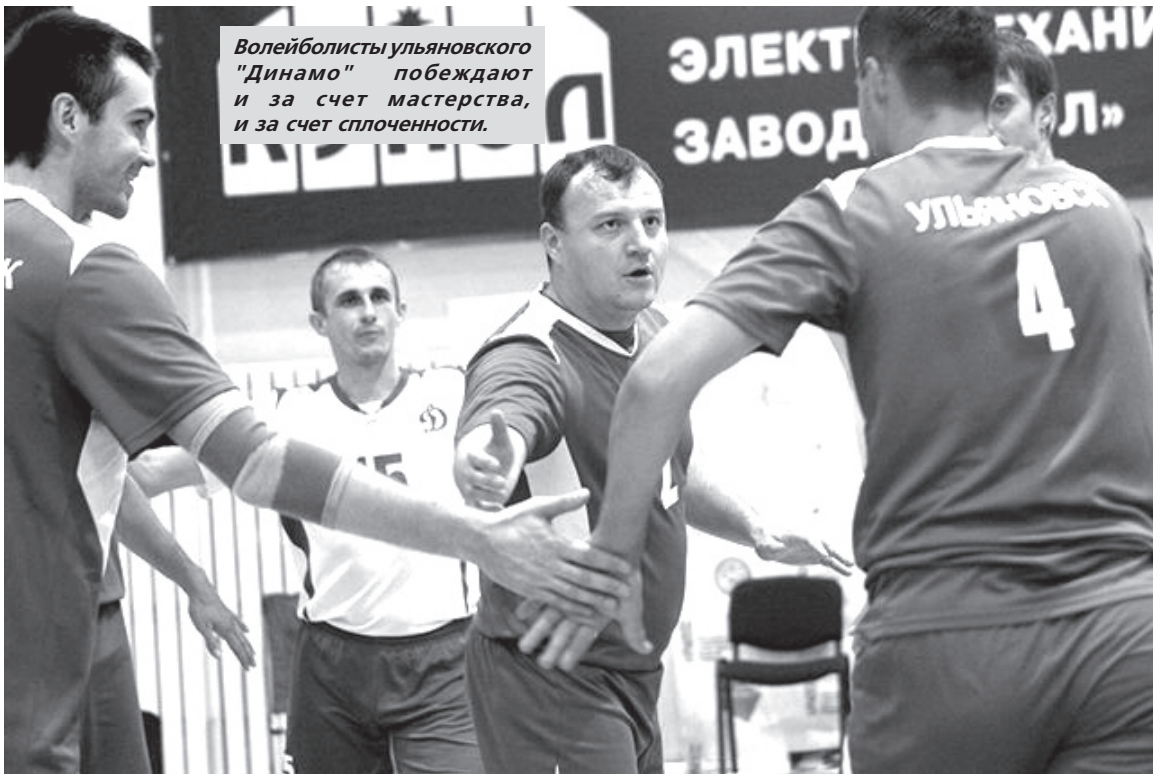
Волейболисты ульяновского "Динамо" побеждают и за счет мастерства, и за счет сплоченности.

Соревнования по волейболу стали очередным этапом во Всероссийской спартакиаде спортивного общества "Динамо". Кроме того, в нее также входят соревнования еще по 11 служебно-прикладным и массовым видам спорта. После баталий в Ижевске Ульяновское региональное отделение "Динамо" занимает пятое общекомандное место. В конце октября состоятся последние старты Спартакиады - чемпионат "Динамо" по плаванию.