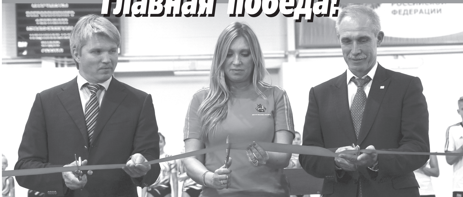
Легкоатлетический манеж "Спартак" открыли олимпийские чемпионы Светлана Мастеркова и Павел Колобков, а также губернатор Ульяновской области Сергей Морозов.

Параллельно с проведением первого Всероссийского фестиваля национальных и неолимпийских видов спорта в Ульяновской области открылись сразу два современных спортивных объекта: стадион в СЕНГИЛЕЕ и легкоатлетический манеж "Спартак" в Ульяновске.