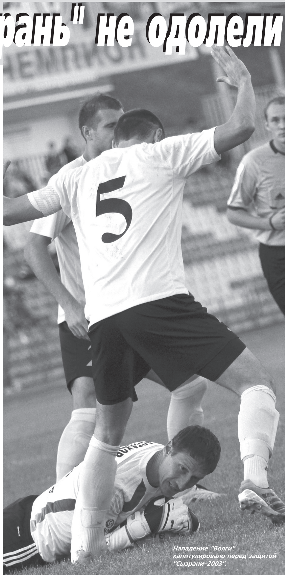
Нападение "Волги" капитулировало перед защитой "Сызрани-2003".

- Считаю, что ничья - закономерный результат. Голевых моментов, по сути, не было, если не считать удар в перекладину наших ворот в первом тайме. Что касается моей команды, то у многих игроков уже на разминке "подсели" ноги - мы всегда сложно переходим с искусственного газона на естественный. Хотя по первым минутам создается впечатление, что "Волга" опасалась нас больше, чем мы ее - как правило, ульяновская команда играет дома более агрессивно.