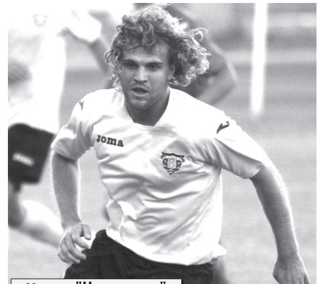
Из досье "Чемпиона"

- Не хотелось бы комментировать этот вопрос. Скажу лишь, что нам не хватало футболистов креативного плана. Каким в свое время был Андрей Аршавин или как сейчас Алан Дзагоев.