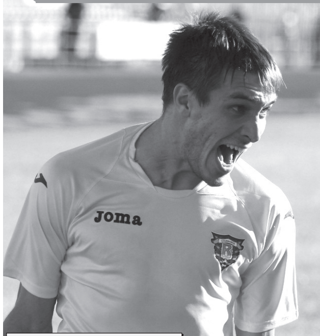
Из досье "Чемпиона"

ФУТБОЛ. Чемпионат России. Второй дивизион. "Урал-Поволжье". Из первых уст