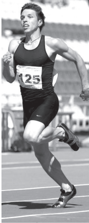
пионат России по легкой атлетике. Честь Ульяновской области будет отстаивать 18 спортсменов.

Уже на следующей неделе, 23 - 27 июля, в Казани пройдет чем-