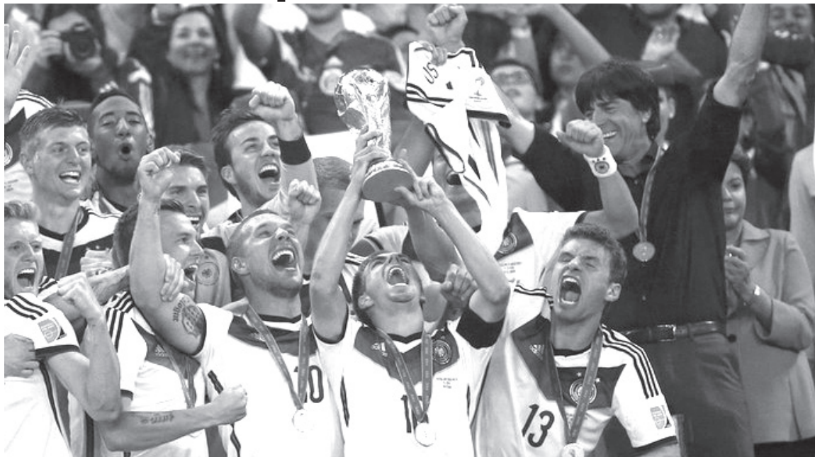
Германия стала первой европейской сборной, победившей на чемпионатах мира в Америке.