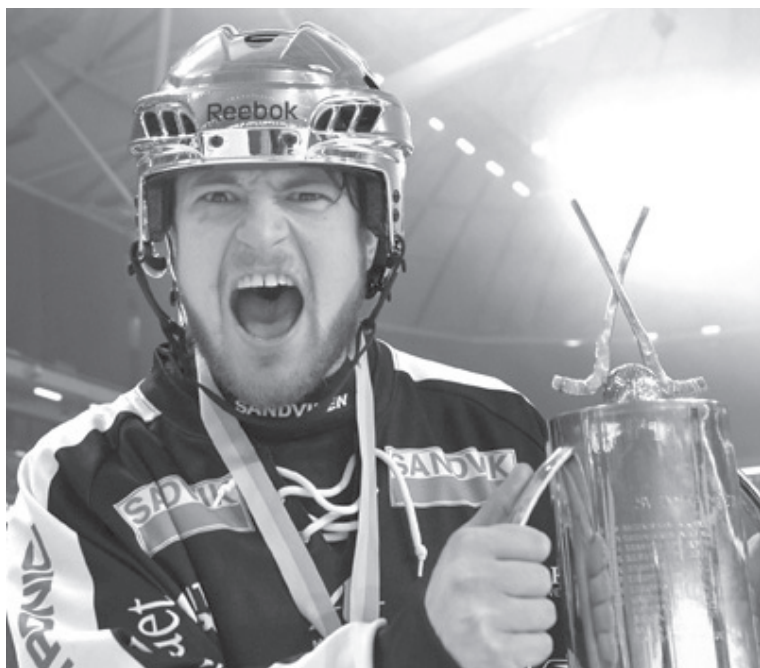
■ Фото www.bandsverige.se

27-летний нападающий "САНДВИКЕНА" и сборной ШВЕЦИИ Кристоффер ЭДЛУНД находится на переговорах в КРАСНОЯРСКЕ.