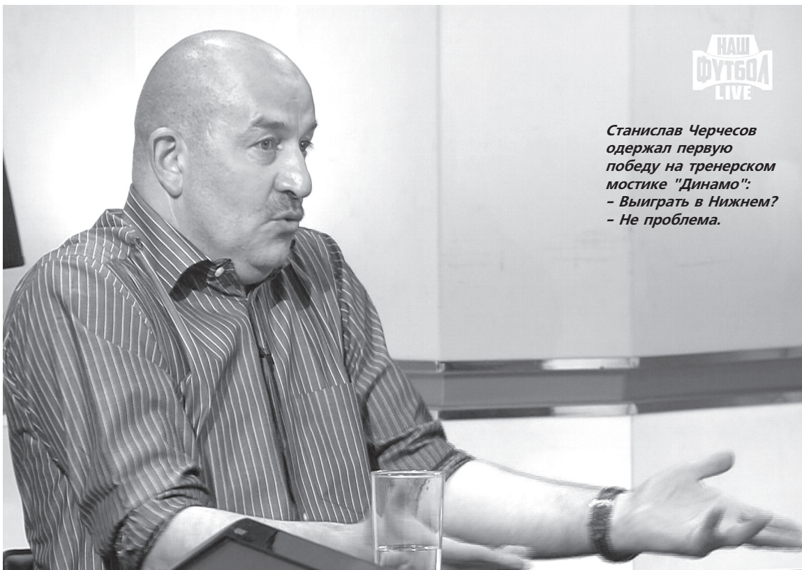
Станислав Черчесов одержал первую победу на тренерском мостике "Динамо": - Выиграть в Нижнем? - Не проблема.

Спартак Нч - Химик, Арсенал - Салют, Торпедо М - Ротор, Шинник - Уфа, Газовик Ор - Ангушт, СКА-Энергия - Нефтехимик, Динамо СПб - Балтика, Мордовия - Луч-Энергия, Енисей - Алания.