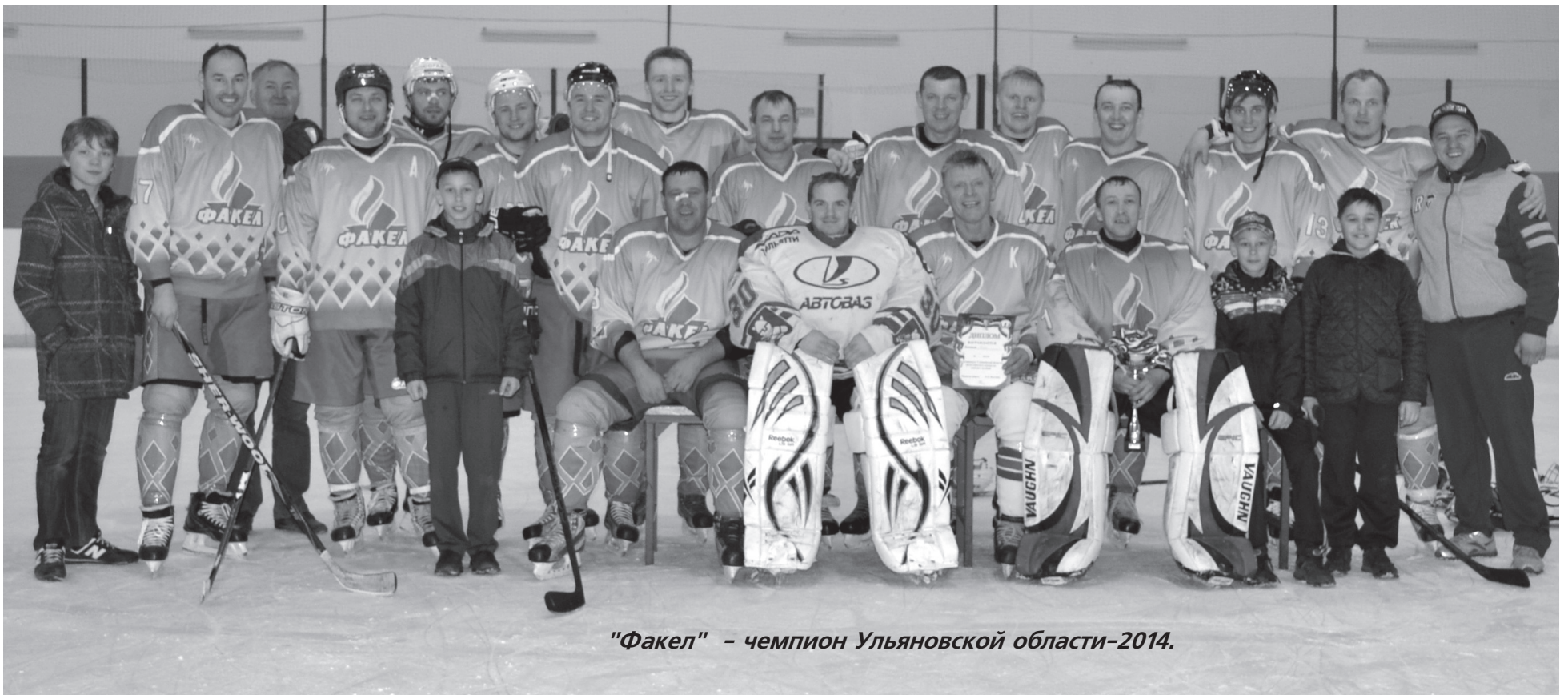
"Факел" - чемпион Ульяновской области-2014.

В РЕШАЮЩЕМ МАТЧЕ ОБЛАСТНОГО ПЕРВЕНСТВА УЛЬЯНОВСКИЙ "ФАКЕЛ" НАНЕС СОКРУШИТЕЛЬНОЕ ПОРАЖЕНИЕ КОМАНДЕ УВАУ ГА И СПУСТЯ ГОД ВЕРНУЛ СЕБЕ ЧЕМПИОНСКИЙ ТИТУЛ.