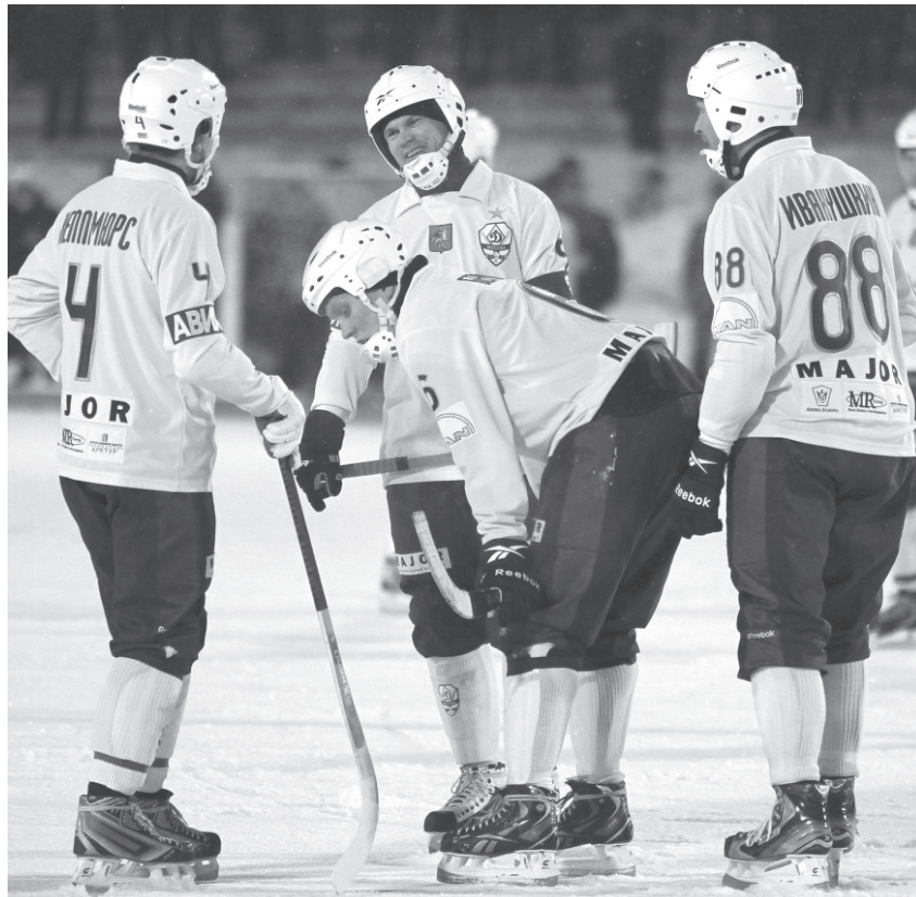
И в будущем сезоне в московском "Динамо" будут знакомые все лица!