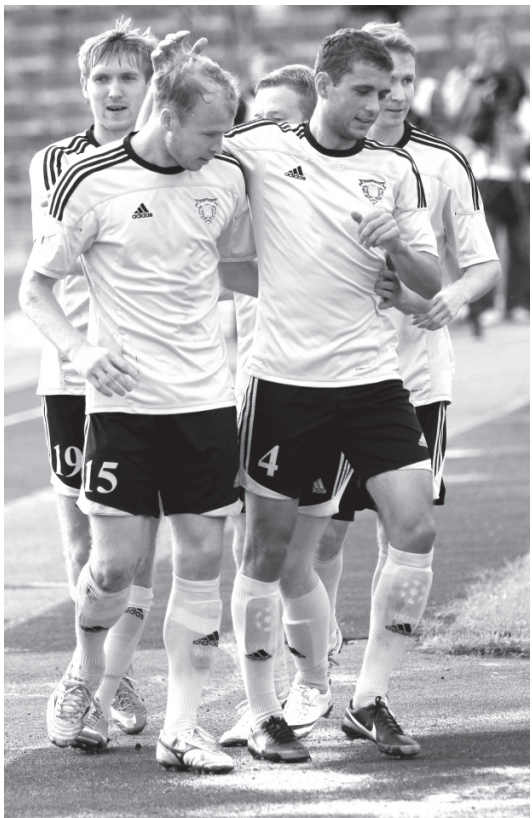
В Турцию "Волга" отправилась с хорошим настроением.

Ульяновская "ВОЛГА" уже расквартировалась в Турции. Сегодня ей предстоит первый контрольный матч в рамках единственного зарубежного предсезонного сбора. Соперник - клуб второго дивизиона зоны "Центр" - рязанская "Звезда".