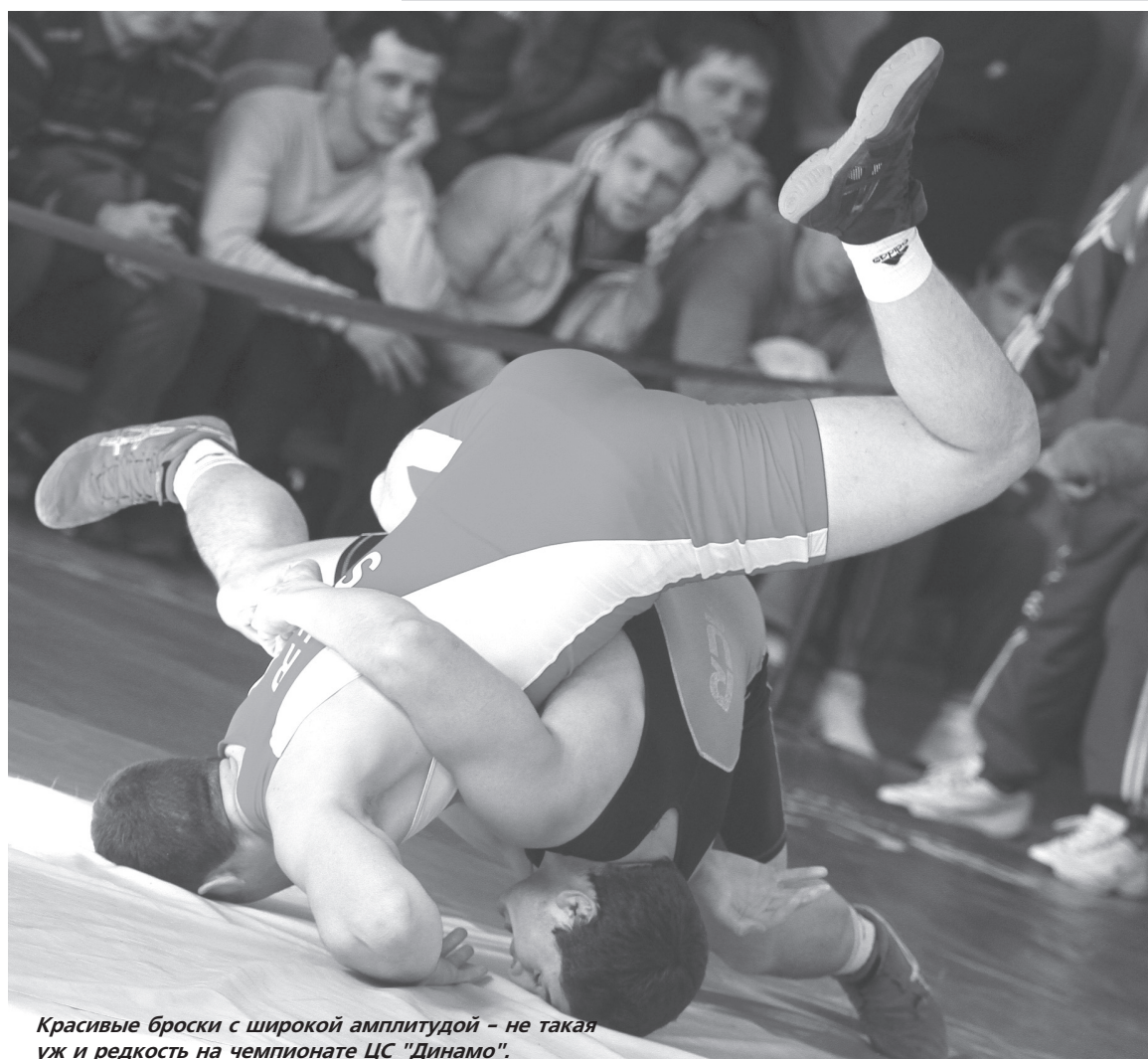
Красивые броски с широкой амплитудой - не такая уж и редкость на чемпионате ЦС "Динамо".