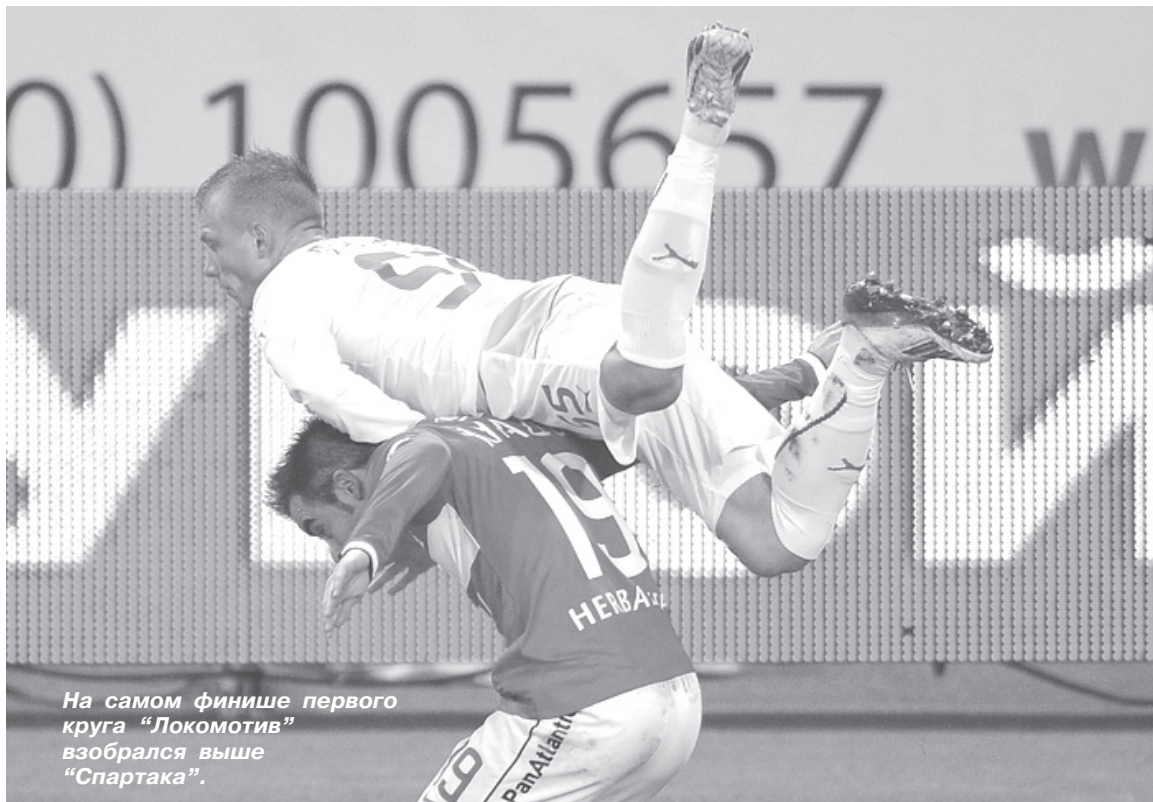
На самом финише первого круга "Локомотив" взобрался выше "Спартак".

Последний тур первого круга выдался, на удивление, "гостевым".