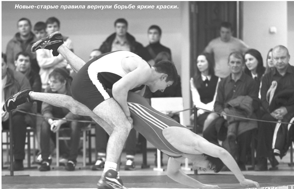
Новые-старые правила вернули борьбе яркие краски.

В ФОКе УлГУ состоялся один из старейших в истории России борцовских форумов - 41-й юношеский турнир памяти дважды Героя Советского Союза Ивана Полбина.