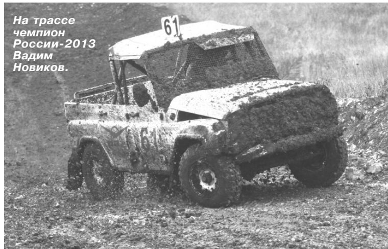
На трассе чемпион России-2013 Вадим Новиков.

СЛЕДУЮЩИЙ НОМЕР "ЧЕМПИОНА" ВЫЙДЕТ 6 НОЯБРЯ, В СРЕДУ