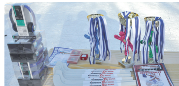
Каждой команде - годовая подписка на «Чемпион» и сувенирная клюшка.