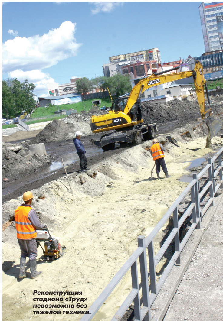
Реконструкция стадиона «Труд» невозможна без тяжелой техники.

Напомним, в ближайшие два года в области темп строительства и реконструкции спортивных объектов не снизится. Кроме ФОКа на улице Шоферов, построят бассейны в Инзе и Ишеевке, спорткомплекс «Союз» в Ульяновске, проведут капитальный ремонт ФОКов в Мулловке Мелекесского района и поселке Мирном Чердаклинского района.