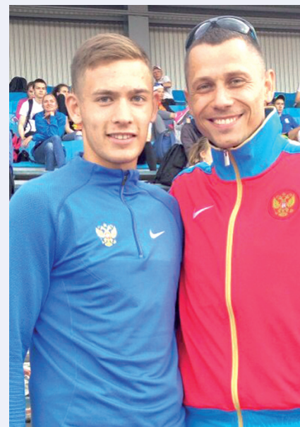
Фото с Юрием Борзаковским (справа) - еще одна награда для Ярослава Шмелева.

Кстати, Борзаковский присутствовал на первенстве России в Челябинске и очень внимательно следил за перипетиями на дистанции 800 метров. После финиша знаменитый стайер лично поздравил Ярослава Шмелева с победой и пожелал ему удачи в будущем.