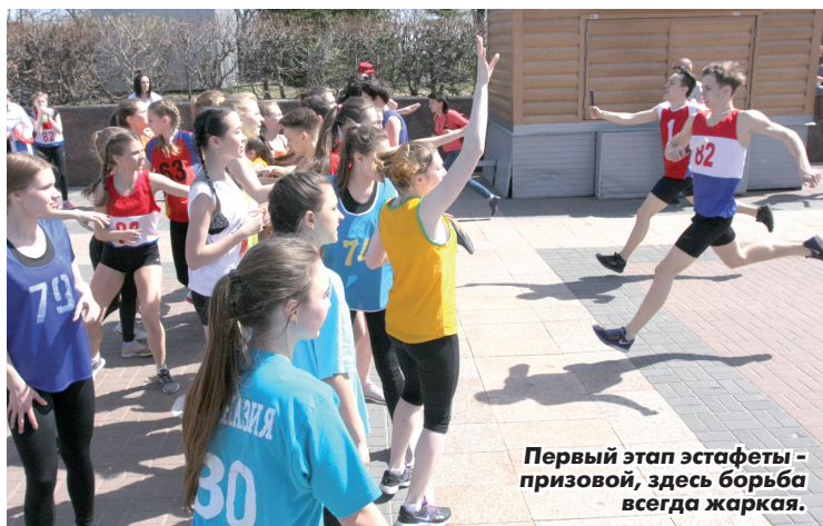
Первый этап эстафеты - призовой, здесь борьба всегда жаркая.

Кстати, Егоровы после победы в 2016-м на сей раз финишировали третьими, пропустив вперед семью Захаровых.