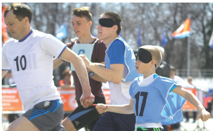
Забег среди слабовидящих уже стал традиционным на нашей эстафете.

Кульминация эстафетного веселья - забег в сильнейшей группе школьников (первые 25 мест по итогам предыдущих соревнований). Главной «перчинкой» этого традиционного «вкусного блюда» стала увлекательная дуэль между старыми соперниками - 82-й школой и первой гимназией. На прикидочных стартах лучше была 82-я. Она и захватила лидерство после непродолжительного всплеска команды технического лицея. Первая вырвалась вперед у обелиска Славы, но чувствовала обжигаю-