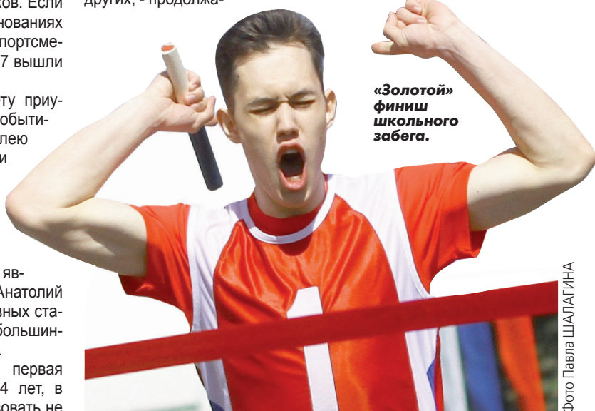
«Золотой» финиш школьного забега.

По случаю юбилея «УП» в комплекте с наградами и призами организаторы, судя по всему, «заказали» и отличную погоду. Нынешняя эстафета стала самой жаркой за последние пять лет. В разгар забегов столбик термометра поднимался до 20 градусов, а обычно угрюмый волжский ветер сменялся приятным весенним бризом.