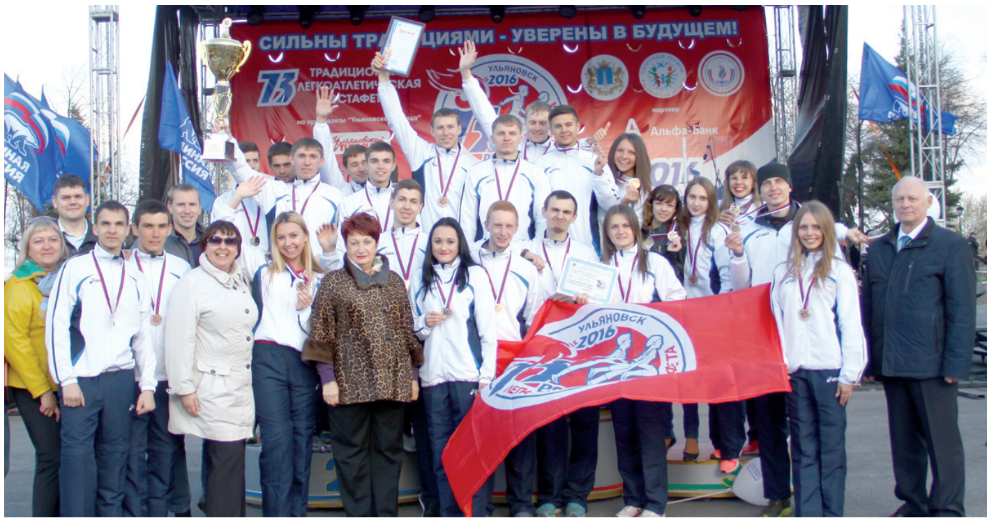
Сборная УлГПУ - чемпион легкоатлетической эстафеты на призы газеты «Ульяновская правда»-2016.