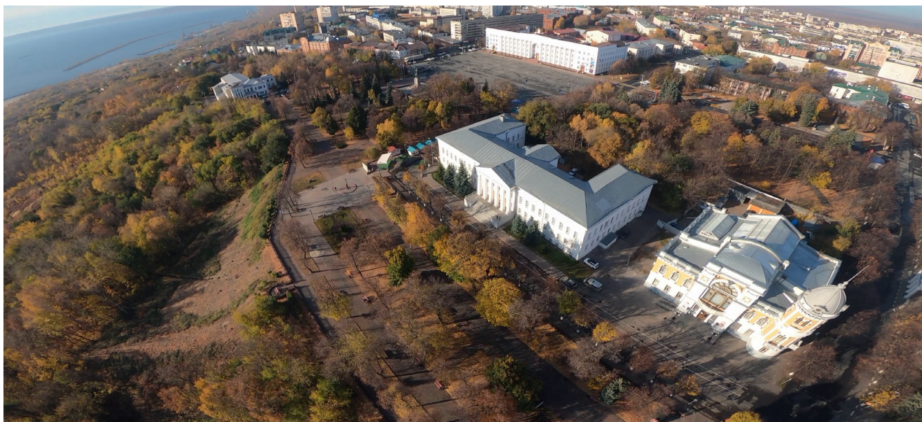
Центральная часть города, где располагался Симбирский кремль. Фото 2020 года

небольшое углубление слева от памятника Карлу Марксу – в районе бывшей северо-западной башни симбирского кремля.