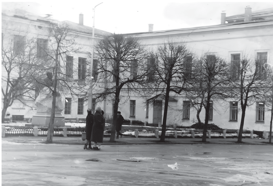
Сквер у Дворца книги – место расположения средневекового могильника. Фото Г.М. Бурова, 1972

На нескольких выявленных Г.М. Буровым памятниках были проведены археологические раскопки. В 1972 году небольшой раскоп был заложен в восточной части поселения Вырыпаевка I, культурный слой которого был насыщен материалами срубной культуры. Поселение Вырыпаевка I до настоящего времени остаётся наиболее изученным памятником срубной культурно-исторической общности на территории Ульяновска.