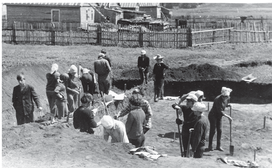
Раскопки на поселении Вырыпаевка I. Фото Г.М. Бурова, 1972

керамика срубной культуры, происходящая из разрушенного курганного могильника. Особый интерес представляют сосуды с загадочными знаками, расположенными, в противоположность орнаменту, асимметрично, без правильного повторения составляющих его элементов. В том же году к западу от деревни Алексеевки на острове в районе рыбацкой стоянки была найдена двупластинчатая застёжка (фибула) середины I тыс. н. э.