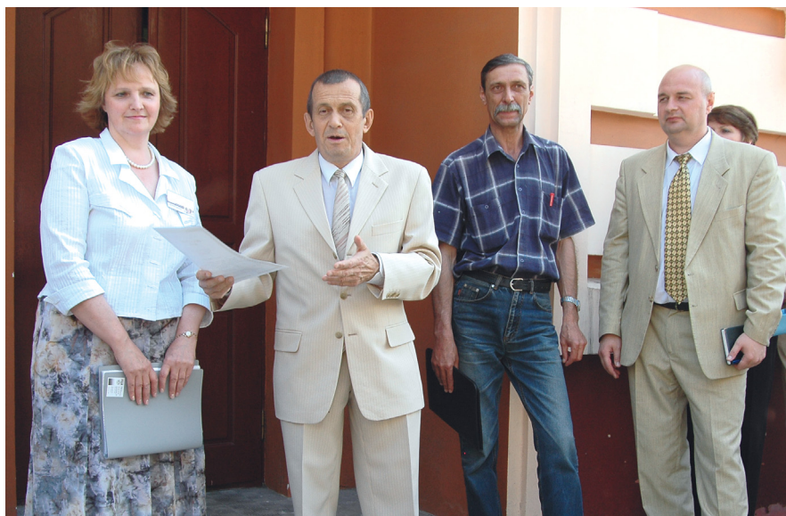
Открытие нового фондохранилища на улице Энгельса, 16