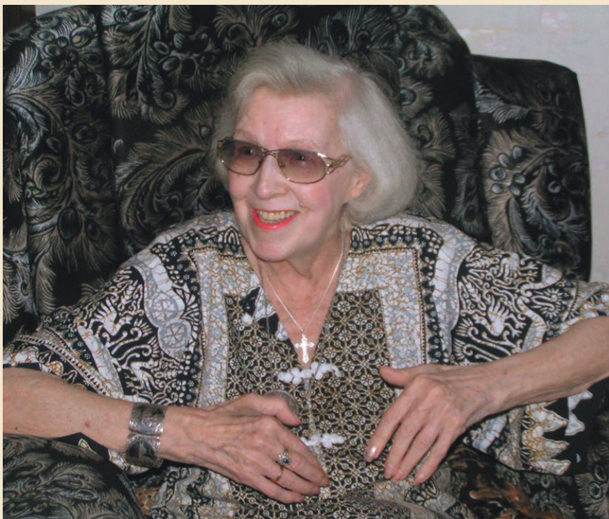
↑ В селе Новосёлки Мелекесского района Ульяновской области. 2006