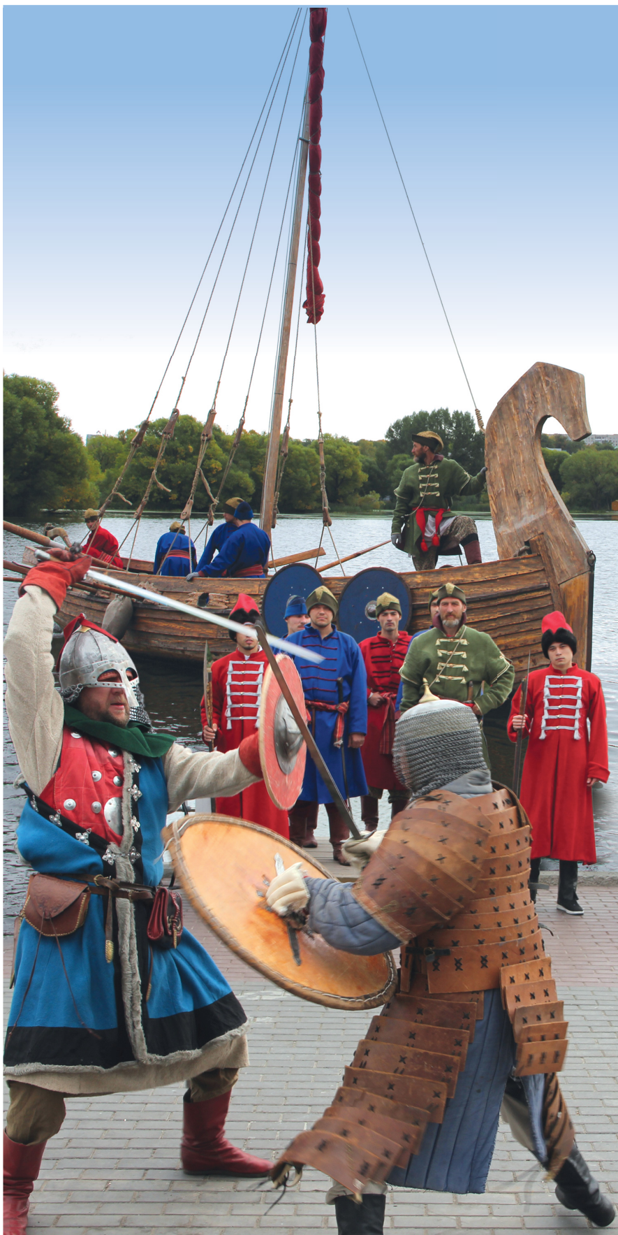
На фото «Прибытие Богдана Хитрово». Театрализованное представление в День города.