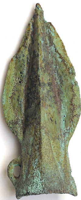
Бронзовый наконечник копья (дротика). Случайная находка, 1971