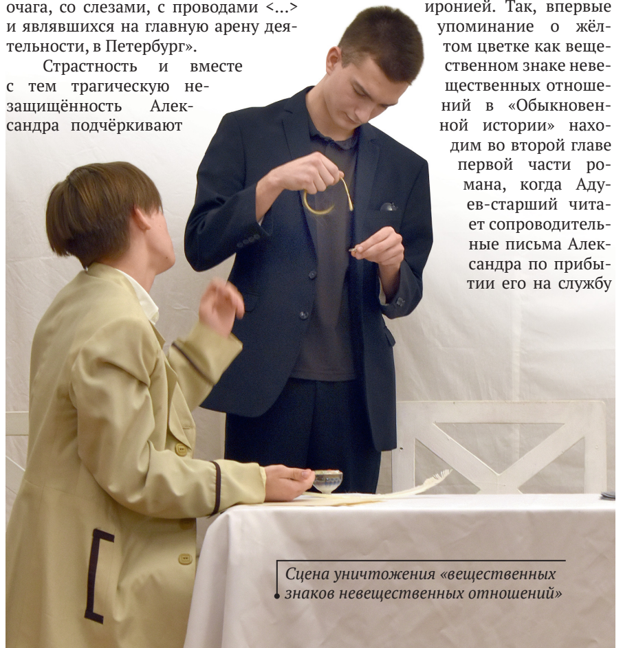
Сцена уничтожения «вещественных знаков невестственных отношений»