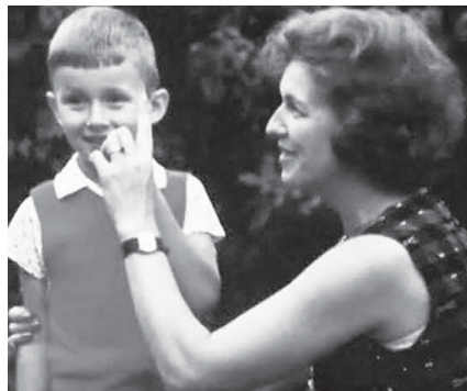
• С сыном