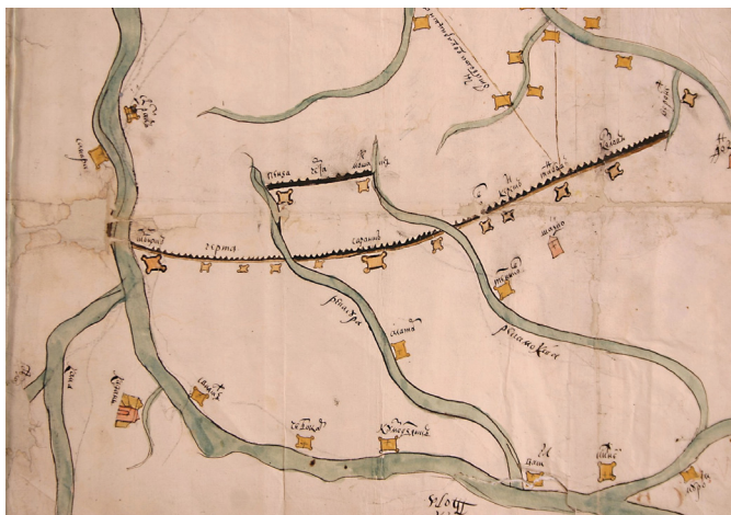
• Схема засечной черты между Воронежем и Симбирском на карте 1696 года. Карта ориентирована на юг (юг вверху)