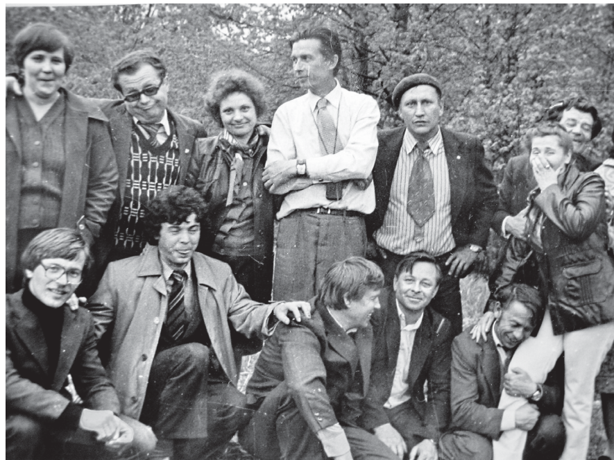
• Коллеги-телевизионщики умели шутить и веселиться