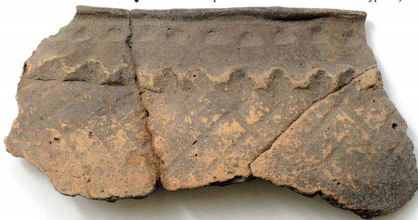
Фрагмент верхней части сосуда эпохи бронзы. Поселение Карлинское III. Разведки Г. М. Бурова, 1972