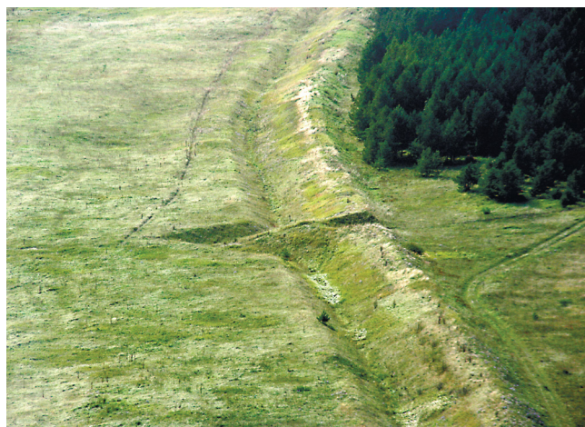
• Башенный выступ засечной черты между с. Баз. Урень и пос. Языково. Фото 2007 года

Известно, что и Симбирск, и укрепления Симбирской засечной черты строились в 1648 году нижегородскими и арзамасскими служилыми людьми. Многие строители получили здесь поместья и стали осваивать территорию края. Память об этом осталась в топонимике области. Это села, получившие название по имени Языковых, Чуфаровых, Аксаковых, Тургеневых, Жадовских, Анненковых, Бугурлиных, Аристовых, Воронцовых, Бекетовых, Ермоловых, Куроедовых, Бахметевых и многих других. В той же мере, как нижегородцы и арзамасцы, в строительстве города активное участие принимали владимирцы, казанцы и другие служилые люди из разных регионов, что нашло отражение в названии целого ряда сёл, названных по имени города, откуда они были переведены: Арское, Тетюшская слобода, Карлинское, Холмогорское, Лаишевка, Уржумское и другие.