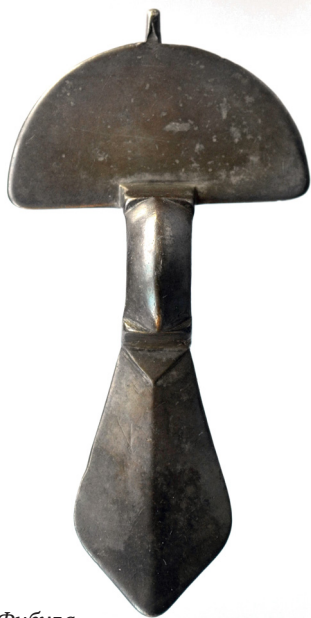
Фибула. Случайная находка, 1973

В 1973 году, в период спада уровня воды в Куйбышевском водохранилище, близ деревни Алексеевки местными жителями была обнаружена