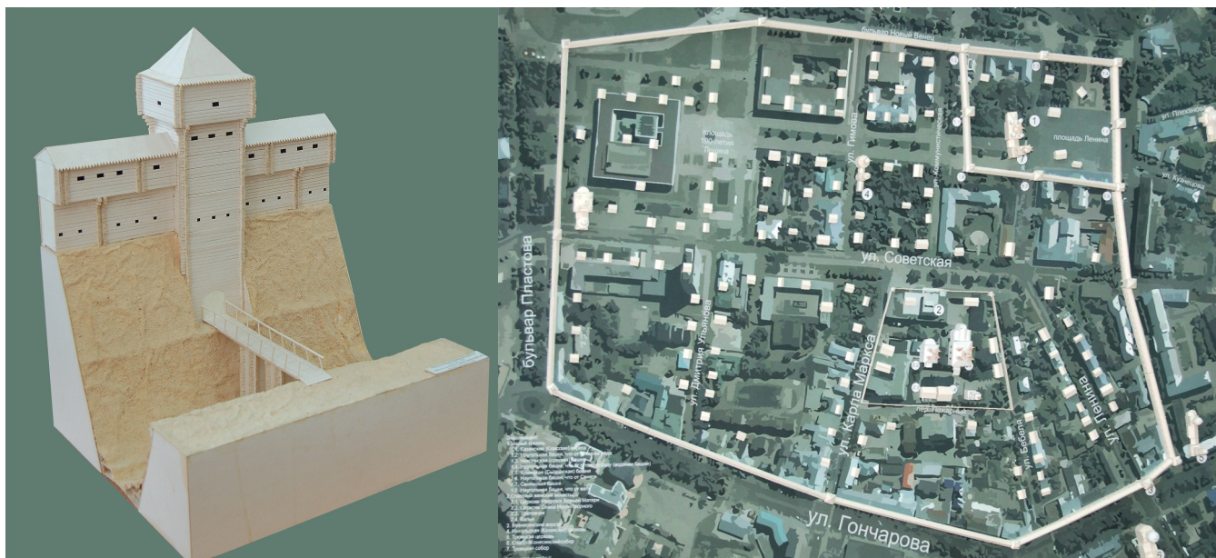
• Макет проездной башни Симбирского кремля