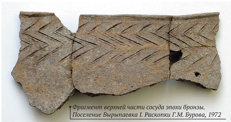
Фрагмент верхней части сосуда эпохи бронзы. Поселение Вырыпаевка I. Раскопки Г.М. Бурова, 1972