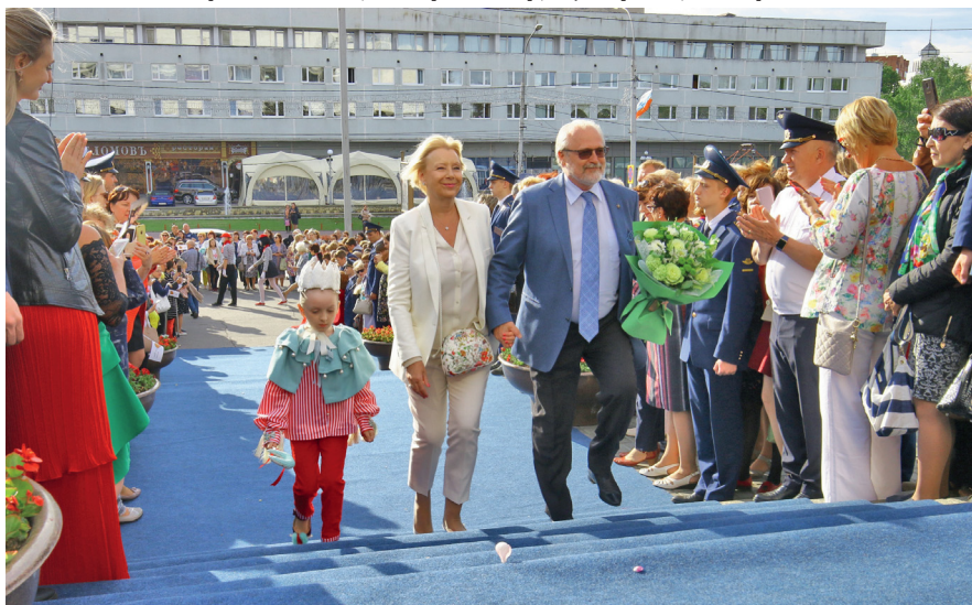
Гость кинофестиваля — народный артист Российской Федерации Владимир Хотиненко, кинорежиссёр, сценарист, актёр. 2018

В 2021 году в рамках кинофестиваля состоялся Поволжский питчинг дебютантов. Три региональных кинопроекта (победители) получили сертификаты на общую сумму более 1 миллиона рублей на дальнейшее