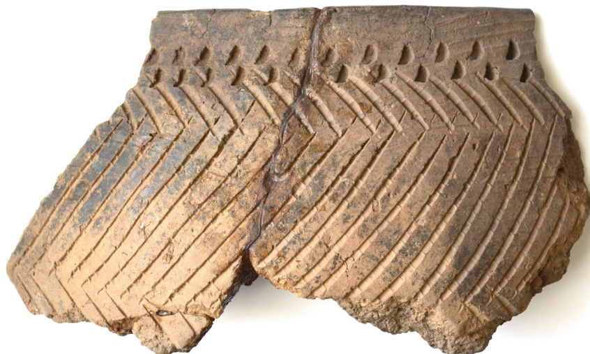
Фрагмент верхней части неолитического сосуда. Поселение Луговое III. Раскопки Г.М. Бурова, 1973

В 1971 году на территории завода «Контактор» экскаватором из земли был извлечён бронзовый втульчатый наконечник копья (дротика) с ушком. Своеобразие ульяновского наконечника заключается в небольших