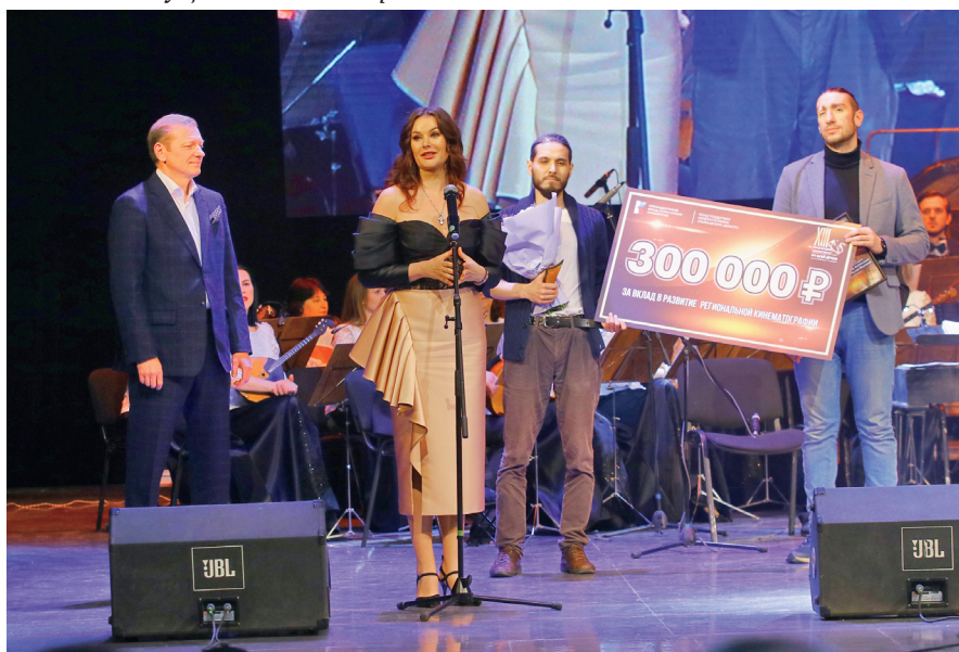
Церемония награждения победителей кинофестиваля «От всей души». Телеведущая Оксана Фёдорова

Внешнеполитическая ситуация оказала влияние на формирование зарубежной программы кинофестиваля. Продолжается сотрудничество с Беларусью, Китаем, Арменией, Турцией. Новые кинематографические связи планируется установить с Узбекистаном, Индией и Ираном.