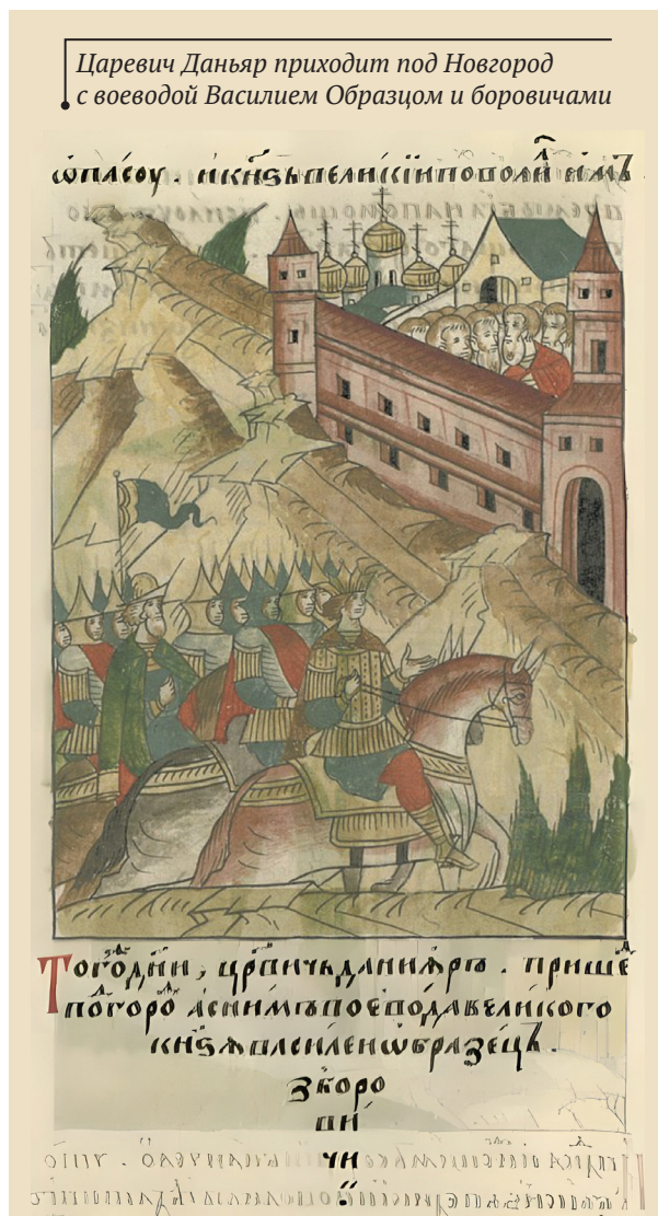
Царевич Даньяр приходит под Новгород с воеводой Василием Образцом и боровичами

После грустной истории с врачом Антоном, т. е. после 1483 года, Даньяр не упоминается в летописных источниках. В современных интернет-источниках иногда говорится, что эта ветвь Чингизидов в России прервалась на Даньяре. Документы, хранящиеся в геральдических