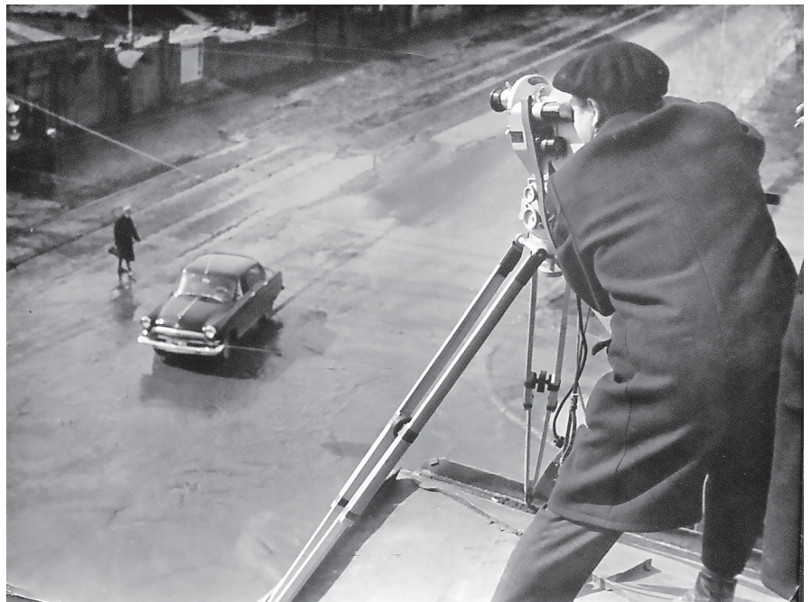
• Съёмка фильма «Ульяновск вчера, сегодня, завтра». На крыше дома – Борис Тельнов

Для отраслевых редакций – промышленной, литературно-драматической, сельскохозяйственной,