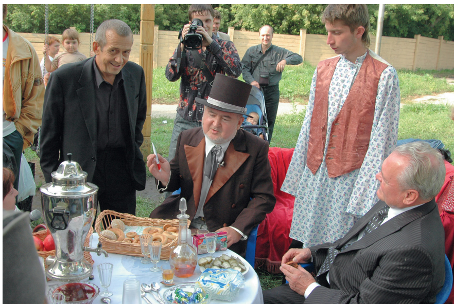
На Обломовском фестивале. 2009