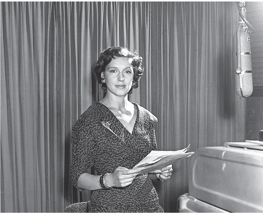
• В телецентре «Останкино»