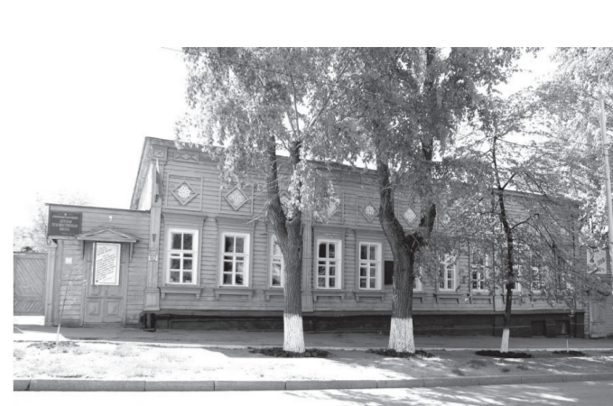
УТВЕРЖДЕНО приказом Министерства культуры Российской Федерации от 2 июля 2015 года № 1906

Фотографическое изображение объекта культурного наследия федерального значения «Дом Костеркина, в котором жила семья Ульяновых в 1875 - 1876 гг.» (Ульяновская область, г. Ульяновск, Ленинский район, ул. Ленина, 92)