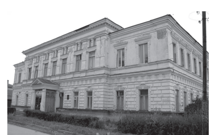
Экземпляр № 4

Фотографическое изображение объекта культурного наследия регионального значения «Здание бывшего уездного земства, где 12/25 декабря 1917 года исполком Совета рабочих и солдатских депутатов принял решение о переходе власти в Сентпай и уезде в руки Советов» (Ульяновская область, г. Сентпай, ул. Советская, 1)