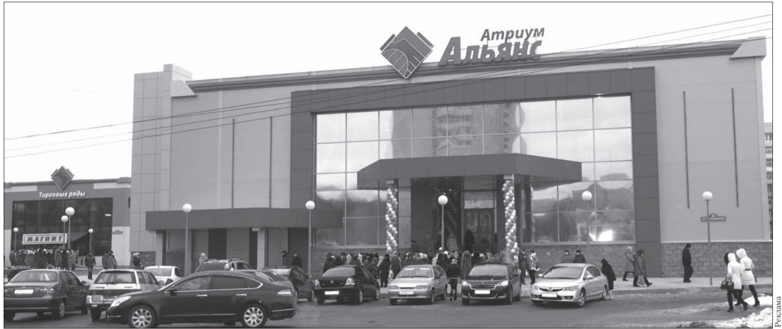
Вид на торговые центры с улицы Промышленной