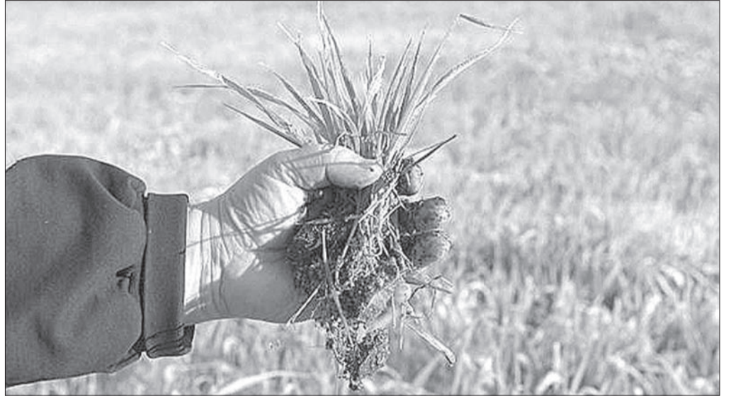
Озимых культур вследствие неблагоприятных погодных условий в этом году посеяно несколько меньше, чем в прошлом

Впрочем, и в 2013-м отрасли растениеводства все же есть чем похвастаться: на 66% в регионе возросло производство подсолнечника, всего намолочено 215 тыс. тонн маслосемян - это максимальный показатель за всю историю Ульяновской области. Кроме того, собрано 442 тыс. тонн сахарной свеклы,